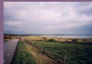
Bevara öppenheten hos klippkust, strandängar och betesmarker.