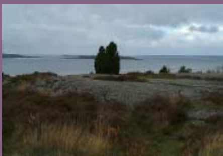
Kuperat kustlandskap med spridda restberg däremellan sandviken