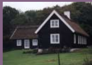
Bebyggelsen vid åkerlandskap och vid klippor bör ges olika karaktär. Tänk på detta när du utformar ditt hus.