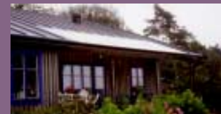
Efterstäva att verandan blir en del av ditt hus. Den kan annars lätt upplevas som ett tillägg i efterhand.