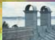
Tänk på att anpassa detaljerna efter byggnadens volym och formspråk. Hus domineras lätt av överstora tak, fönster och socklar.