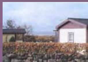
Tänk på grannarna och bygg inte för högt. Låt alla få en utik mot havet!