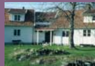
Bygg ut bevarandevärda hus genom att i ex lägga till en ny byggnadskropp. Låt en enkel länk binda dem samman.