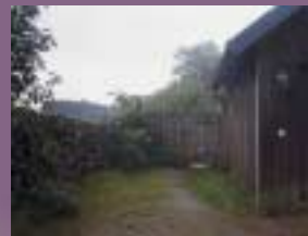
Undvik stora hårdgjorda ytor. Smyg in parkeringsplatser, lägg hellre plattor i gräs än hela asfaltytor. Låt gärna naturen själv bilda gräns kring tomten. Eller använd enkla gårdsgårdar i trä eller sten. Undvik höga murar och plank.