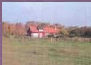
Tänk på siluettverkan och lägg gärna husen intill berg, trädgångar eller befintliga hus. Låt inte husen sticka upp över trädtopparna.