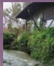
Placera huset så att du undviker sprängning, schaktning och utfyllnader. Låt naturmarken komma nära ditt hus.