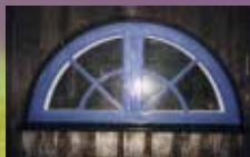
Tillbyggnader ska harmoniera med det ursprungliga husets volym och formspråk