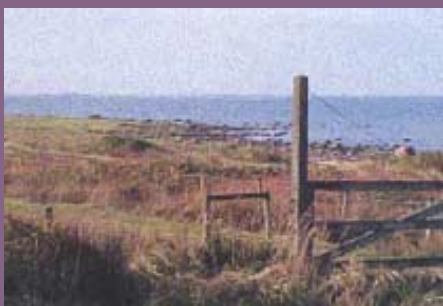
Slättlandskap med kustslätt, betade strandängar och sandstrand