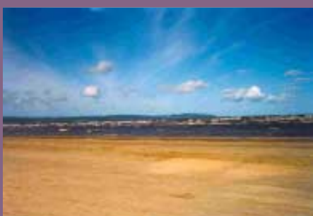
Sandyner med sandvandringskust

Hallandskusten skiftar från klippkust i norr till sandstrand i söder, från kobbar och skär till öppen bukt.