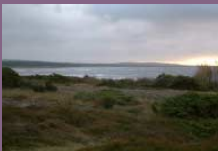
Buktande kustlinje med slättlandskap, utskjutande berg och sandstränder