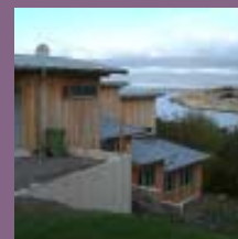
Bryt ner stora volymer i flera mindre. Dessa är lättare att anpassa till landskapet. Låt huset och altanen följa markens lutning.