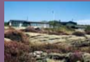
Anpassa färgvalet till naturen och den lokala traditionen. Undvik skarpa färger på stora ytor!