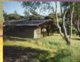
Gör så få ingrepp i naturen som möjligt! Behåll naturmarken - den kräver minst skötsel. Spara befintliga träd och buskar som ger skydd för vader och vind. Vid nyplantering, använd växter som naturligt finns på platsen.