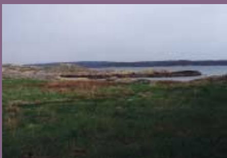
Berg och vikar med slättland, hällmark, hedar och strandängar