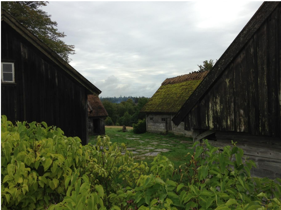
Figur 1. Åskhults by i Kungsbacka kommun.

Ytterligare åtgärder kan vara att utveckla och implementera bevarandeplaner för kulturhistoriska byggnader och kulturmiljöer, som även omfattar åtgärder för att skydda dem mot extrem värme. Dessa planer bör vara anpassade till specifika kulturvärden och omfatta regelbunden övervakning, underhåll och nödvändiga åtgärder för att bevara de kulturhistoriska byggnaderna och kulturmiljöerna.