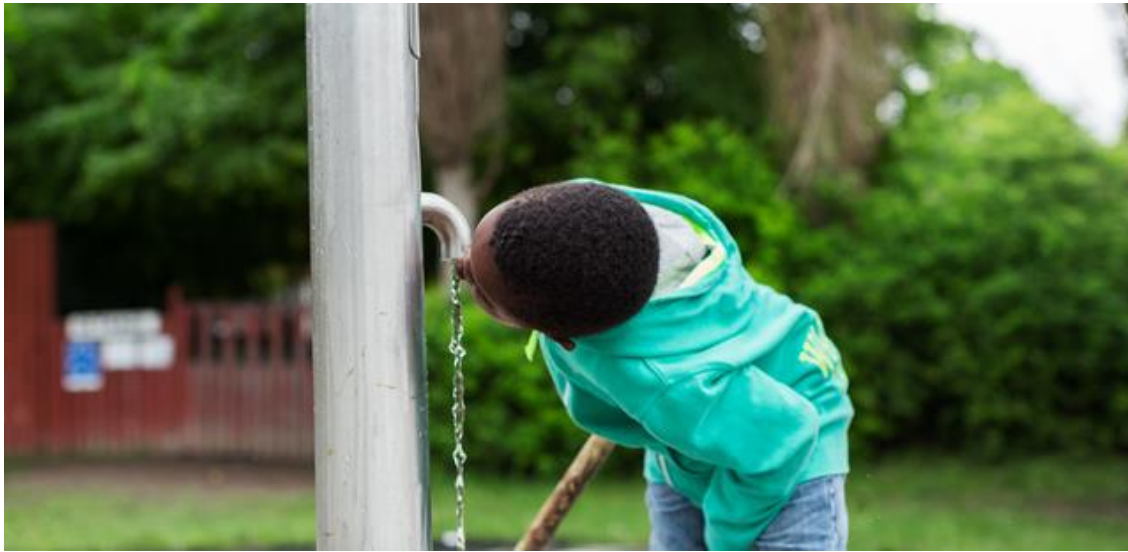
Figur 1. Under värmeböljor är det viktigt att se till att alla dricker vatten.

hålla sig hydrerade. Se till att vattentillförseln är lättillgänglig både inomhus och utomhus, och att vattenflaskor finns tillgängliga för barnen att fylla på under dagen.