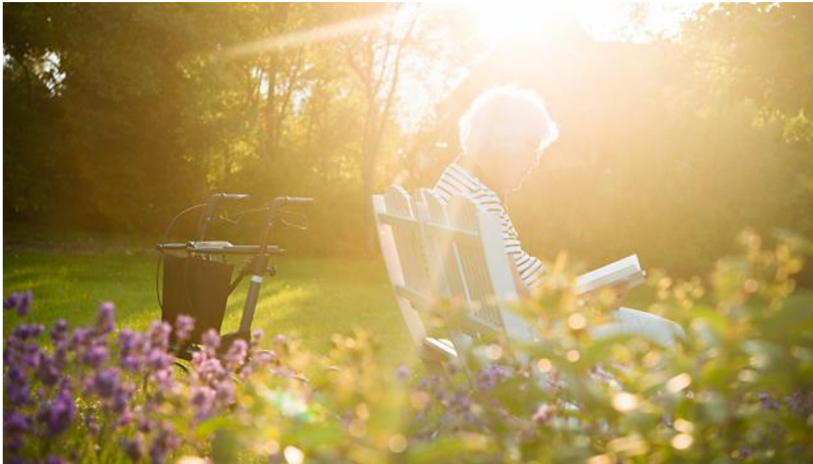
Figur 1. Under värmeböljor kan det vara lämpligt att justera tiden för utomhusaktiviteter till tidigt på morgonen eller senare på kvällen. Källa: Johner Bildbyrå.