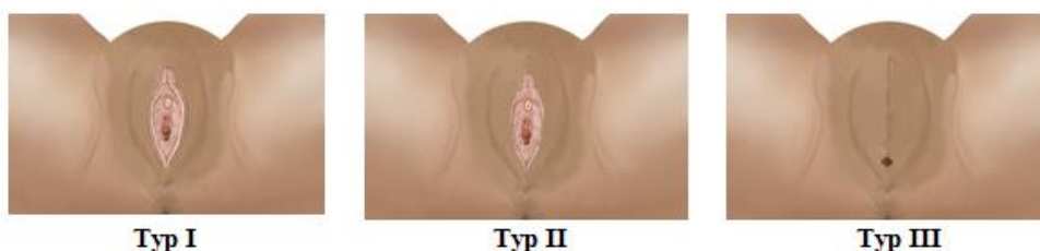
Figur 1 Tre typer av könsstympling enligt WHO:s klassificering.

WHO (2007) delar in Kvinnlig könsstympling i fyra olika typer, de har också en indelning i subtyper som går att läsa om på WHO (2007).