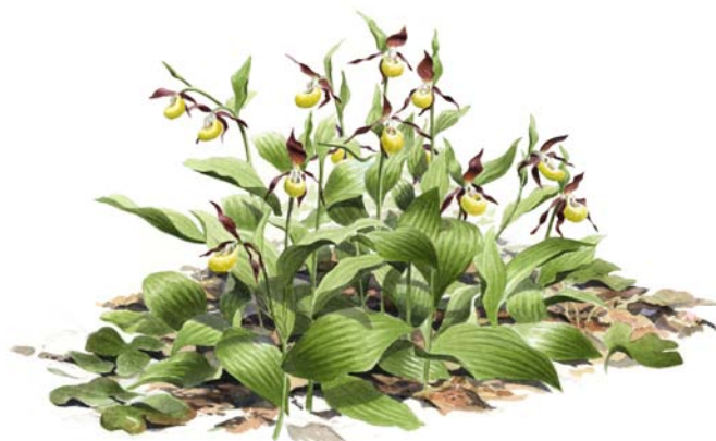
Guckusko. Illustration: Niklas Johansson.

Här möts flera arter med sydlig och nordlig utbredning, bland annat sällsyntheterna loppstarr och fågelstarr. Ängens slå maskinellt med slåtterbalk, men även lie används på känsliga växtplatser. Efter slåttern, som sker i augusti, efterbetas ängen. Fältgentianan har kommit tillbaka och verkar öka i antal för varje år.