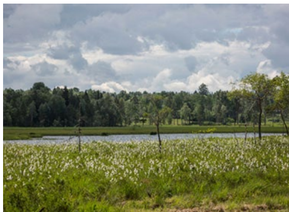
Venakärret (ovan), kärrknipprot (till höger).