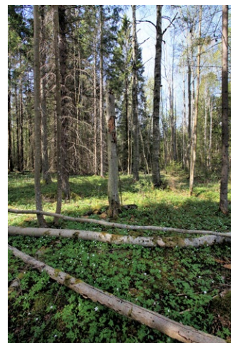
Från vänster ses Lannaforskärret, före detta kalkbrott, tibast och blandskog med både barrträd och lövträd.

Naturreservatet Kanterboda ligger i Kilsbergens sluttning. Naturreservatet kom ursprungligen till för att skydda det bestånd av idegran som växer ymnigt i området. På senare år har naturreservatet utvidgats avsevärt till att omfatta mer av de ovanliga naturtyperna kalkbarrskog och rikkärr.