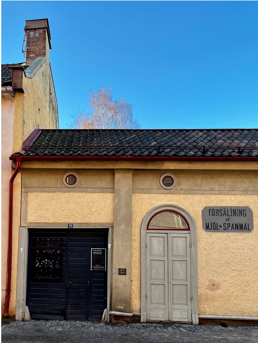
Figur 3. Handelsboden mot gatan. Till vänster portlidret in till innergården. Dubbeldörren till höger öppnas direkt in till butikslokalen.