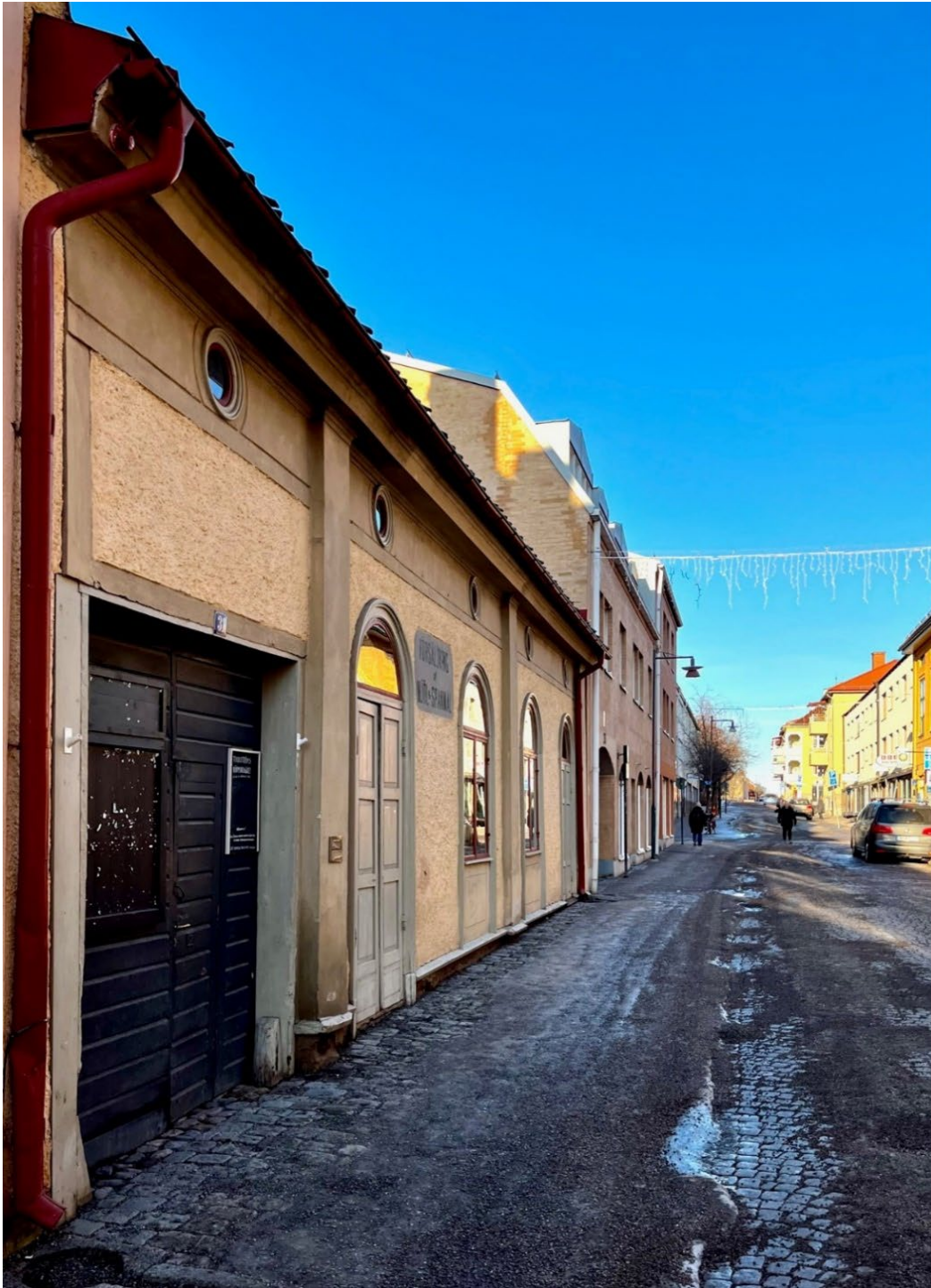
Figur 2. Butikslängan ligger i liv med gatan.