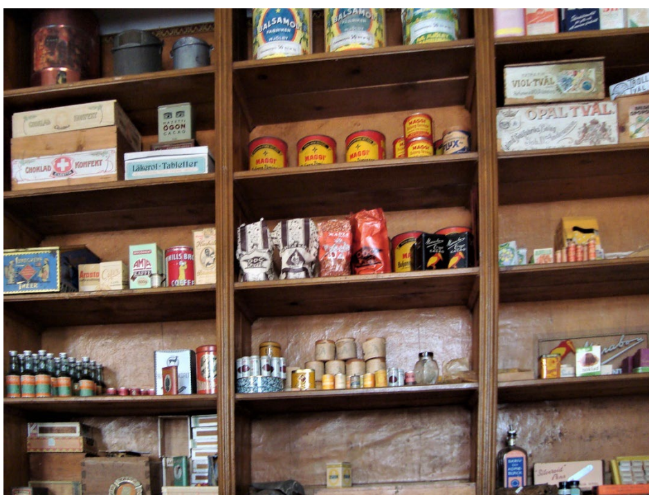
Figur 6. Välbevarad butiksinnredning.