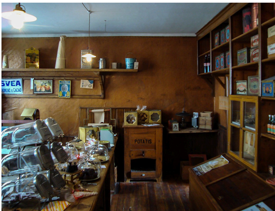
Figur 5. Den väggfasta butiksinnredningen är intakt från 1897.