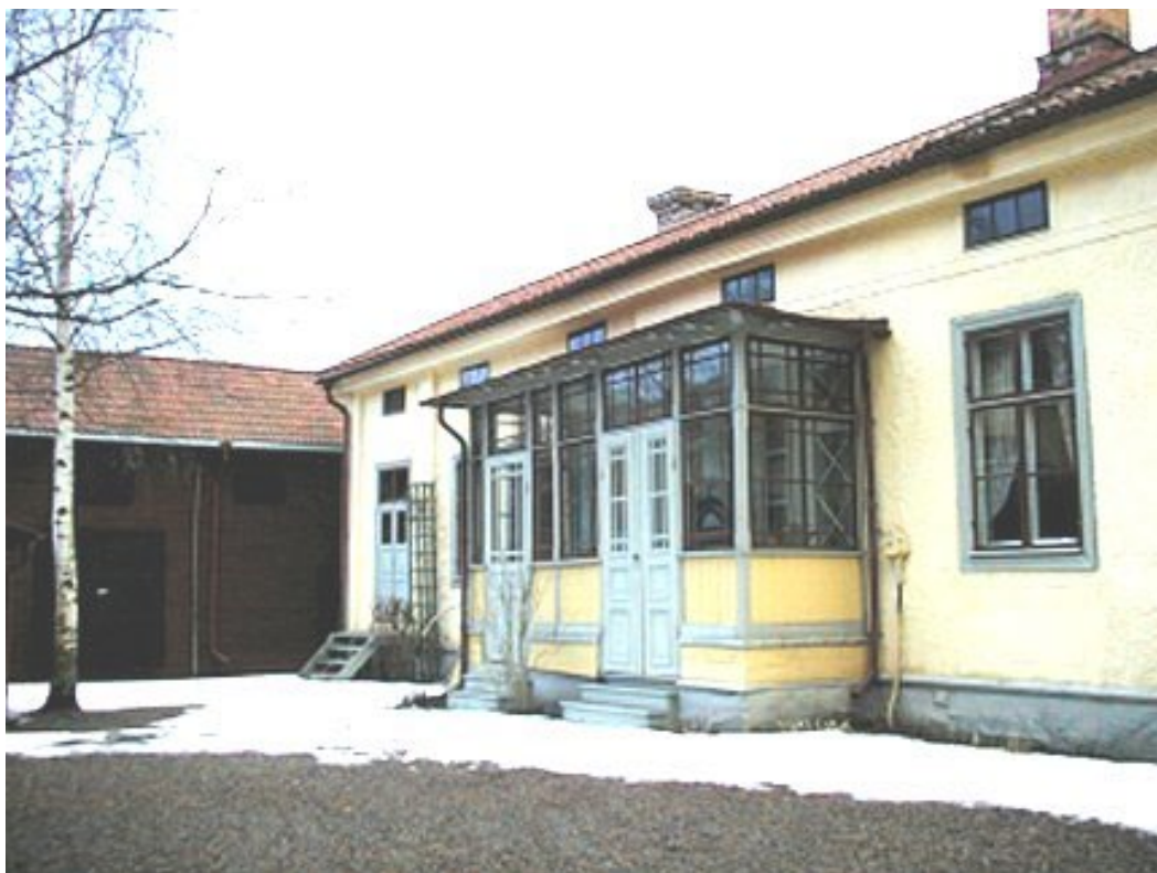
Figur 1. Thunströms köpmansgård är ovanligt välbevarad kringbyggd stadsgård i centrala Falun, såväl exteriört som interiört.