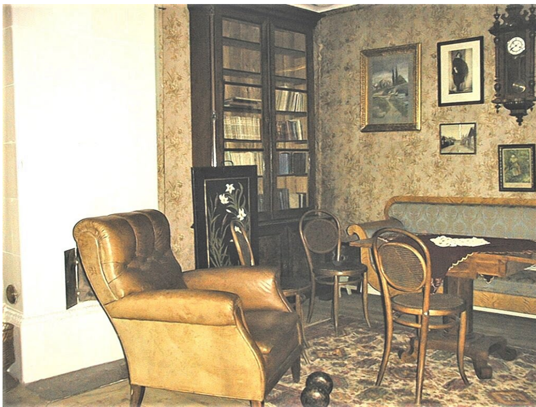
Figur 7. Vålbevarad interiör i bostadshuset.