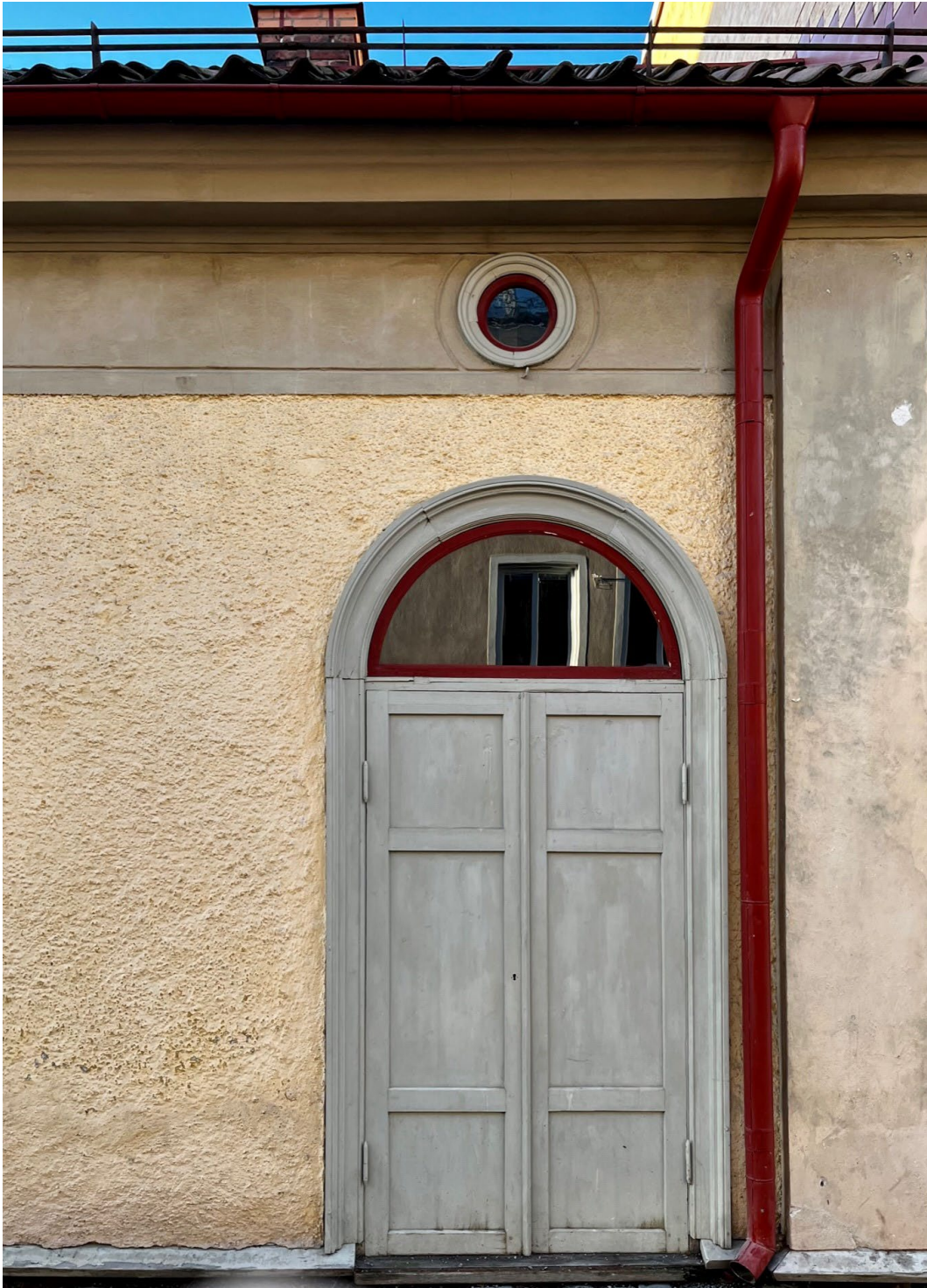
Figur 4. Butiksbyggnadens reveterade fasader har gulffärgad spritpits, med grå omfattningar och dörrar. Slätputsade listverk i grå kulör.