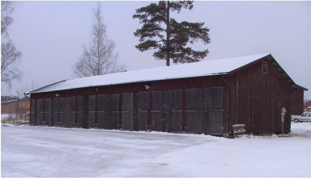
Figur 11. Kompaniförråd.