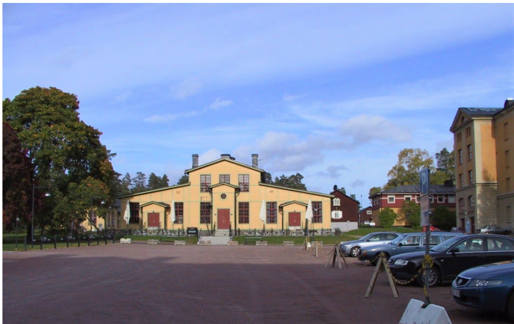
Figur 2. Gamla matsalen (byggnad 5).

Själva regementsområdet präglas av det klassiska mönster som återkommer i denna typ av militära anläggningar. Byggnadernas enhetliga färgsättning i gult och falurött ger området ett sammanhållet uttryck.