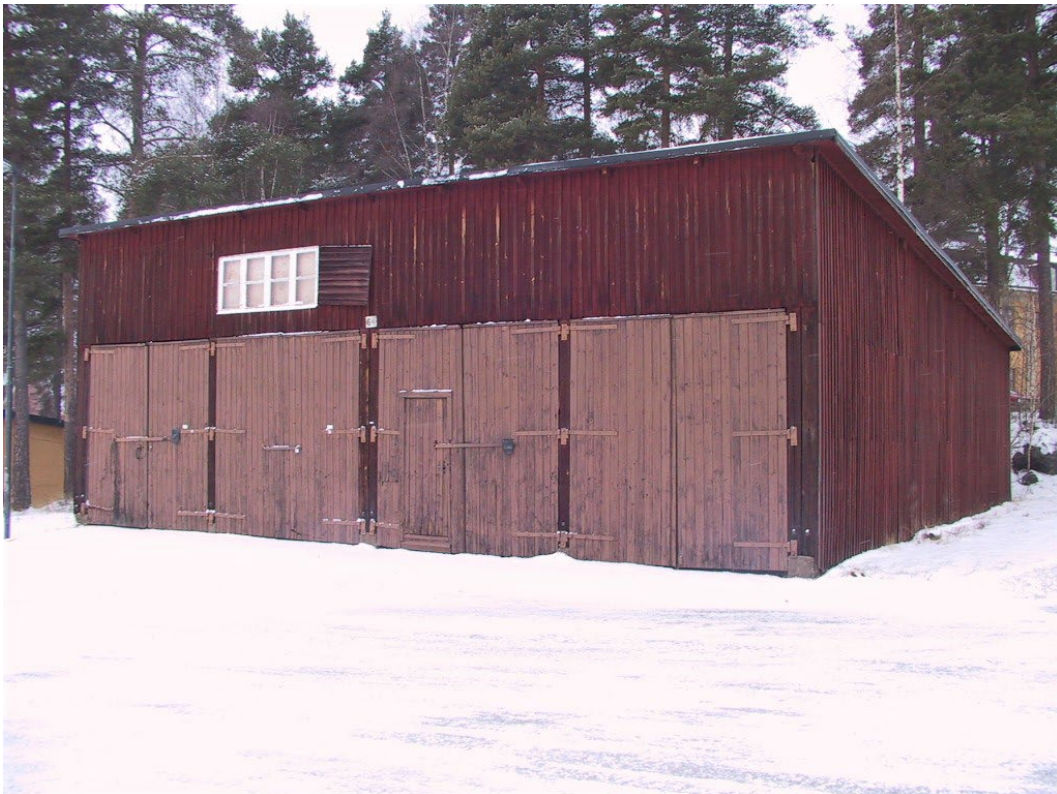
Figur 12. Kallgarage.