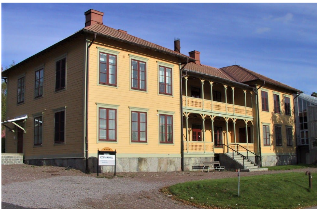
Figur 5. Administrationsbyggnaden (byggnad 7), flyttad från Rommehedslägrret i Borlänge.