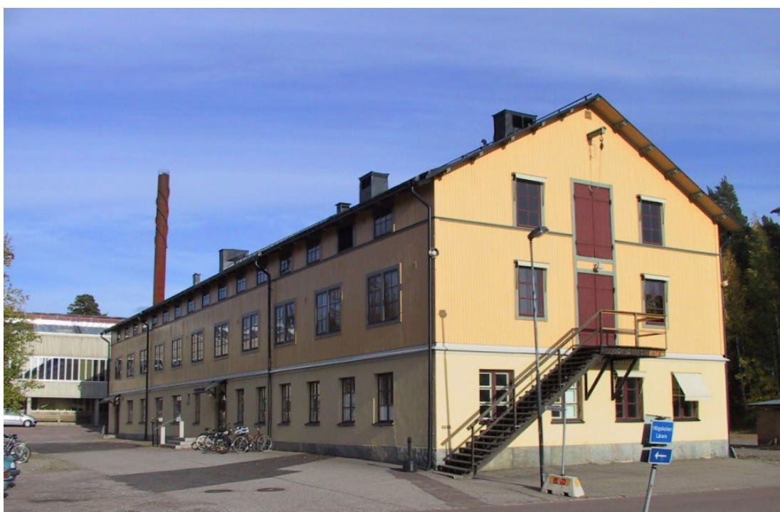
Figur 6. Förrådsbyggnad (byggnad 9). I bakgrunden mässen från 1970-talet (byggnad 101)