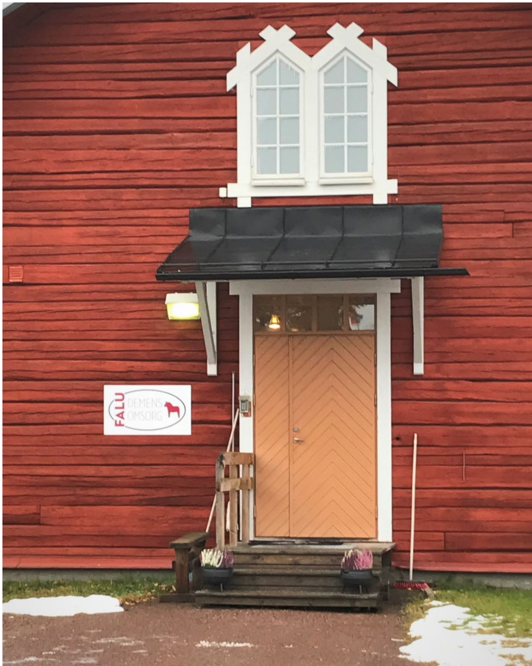
Figur 10. Entre till expeditjonsbyggnaden, fd proviantmagasin.