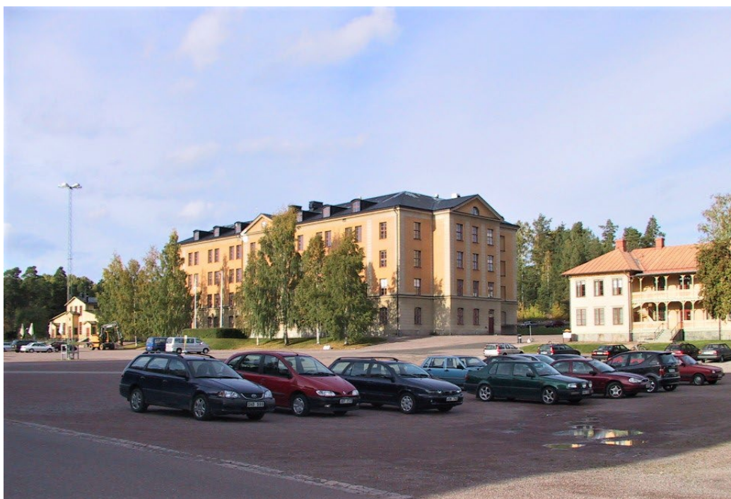
Figur 1. Gamla matsalen (byggnad 5) , kasern C (byggnad 6) och administrationsbyggnaden (byggnad 7) från vänster. Kaserngården i förgrunden.

Anläggningen i Falun för I13 uppfördes efter ritningar utarbetade av arkitekt Erik Josephson, som även ansvarade för planläggningen av Arméförvaltningens övriga etablissemang. Området är uppfört enligt ett klassiskt mönster som återkommer i typanläggningar utformade av arkitekt Josephson. Anläggningen är komplett och innehåller alla typer av byggnader som ingår i ett etablissemang av denna typ. Viktiga karaktärsbyggnader som matsal, gymnastikbyggnad och markenteri är välbevarade. Anläggningen stod klar 1909.