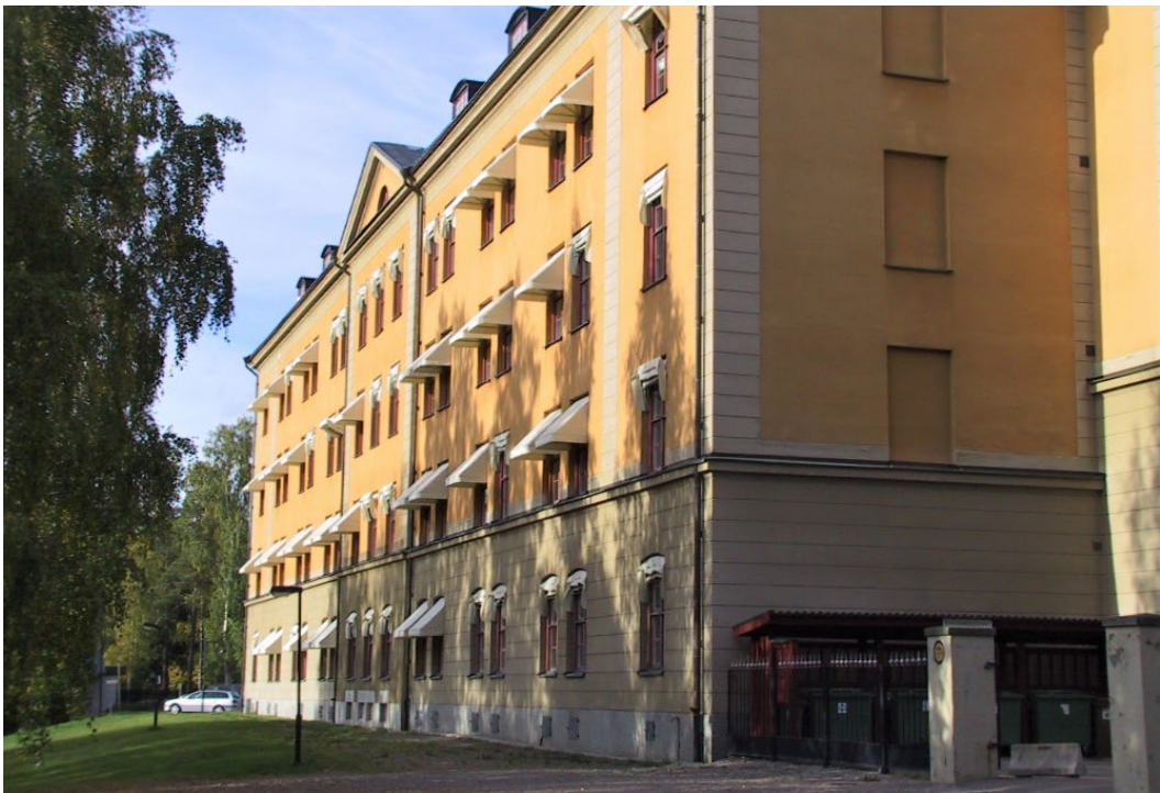
Figur 3 - 4. Kaserngårdens bebyggelse sedd från parken i söder. Det klassicistiska formspråket är återkommande på hela regementsområdet.