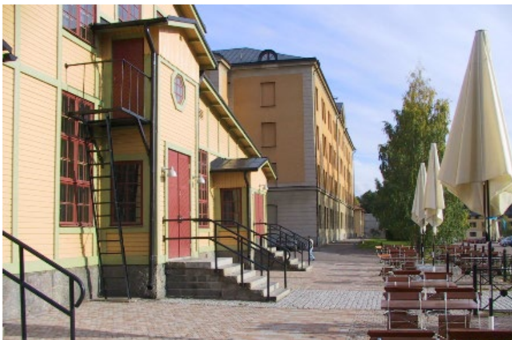
Figur 7. Gamla matsalen med kasern C i bakgrunden.