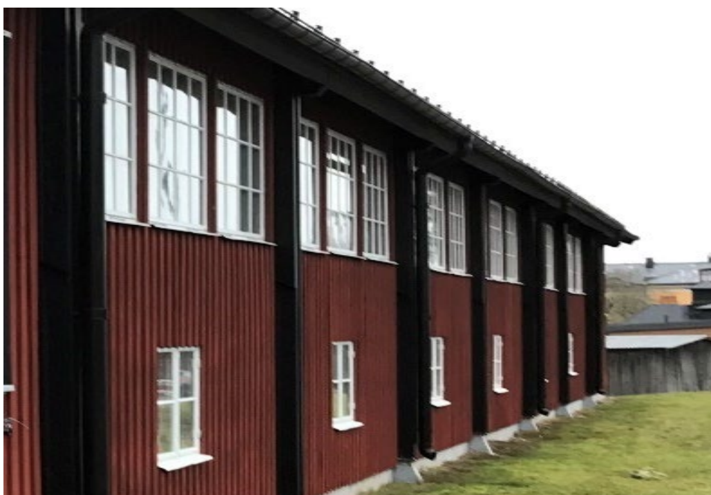
Figur 9. Fd exercishus. Nyttobyggnader är generellt rödmålade till skillnad från militära byggnader av högre status.