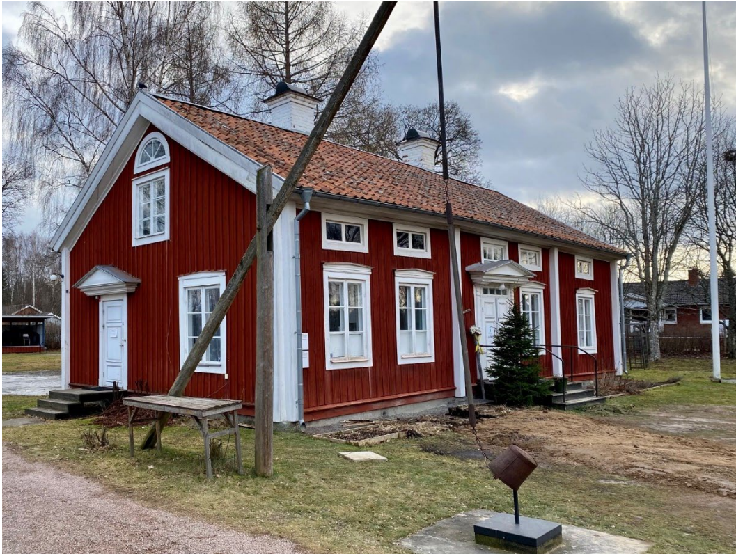
Figur 3. Det yngre bostadshuset längs gårdsplanens södra sida.