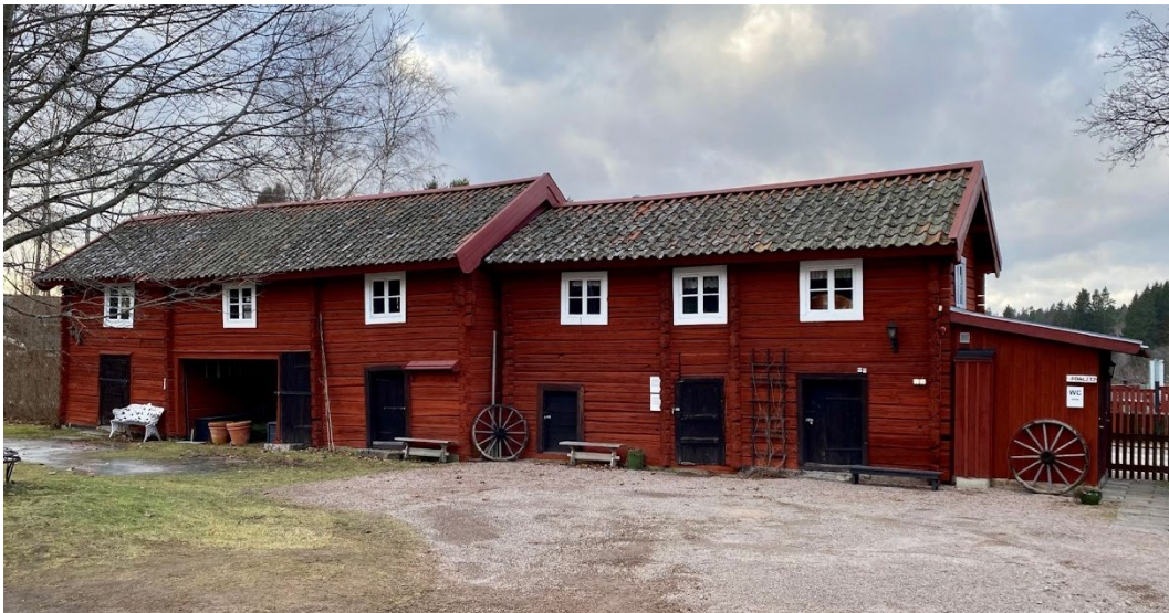
Figur 4. Uthuslängan, längs gårdsplanens norra sida. Karlfeldts arbetsrum finns bevarat i portliderbyggnaden.