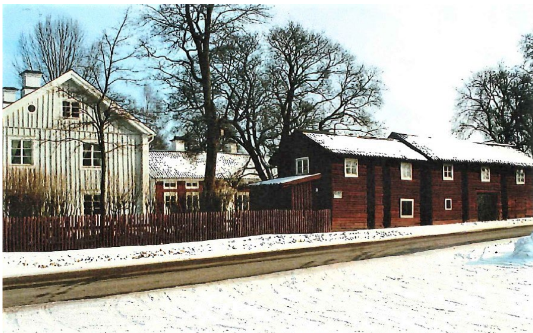
Figur 1. Karlfeldtsgården med Brunnbäckvägen i förgrunden.

Tolvmansgården eller Karlfeldtsgården som den också kallas, ligger endast ett par hundra meter från Dalälvens strand och dryga kilometern från Brunnbäck. Gården är belägen i byn Karlbo och omges numer av villabebyggelse. Marken är flack. Gården består av två boningshus, uthuslänga och källare. Gårdsanläggningen är omgärdad av ett rött spjälstaket samt häckar. Gårdsplanen är täckt av en gräsmatta bevuxen med enstaka träd. I södra delen av gården står en porträttbyst av Erik Axel Karlfeldt omgärdad av en låg tegelmur.