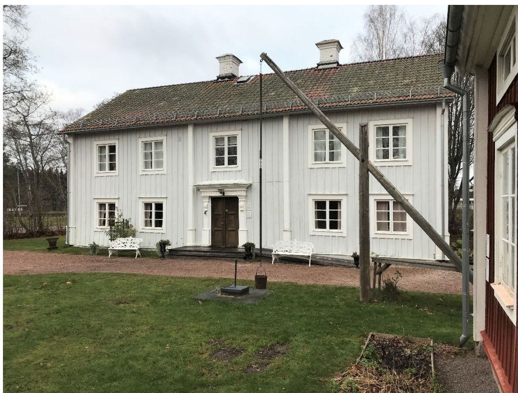
Figur 2. Bostadshuset uppfört på 1700-talet.

Längan med uthus, som flankerar mangårdsbyggnaden på västra sidan om gårdsplanen är den rest som idag finns kvar av jordbruksbyggnaderna på gården. Uthusen är knuttimrade och står på svartgrå cementerad stensockel. Sadeltaken täcks av enkupigt taktegel. Fasaderna är rödfärgade och har svarta stockändar, vindskivor och dörrar samt vita fönsterinfattningar. I uthuslängan finns det rum som Karlfeldt använde som studerkammare.