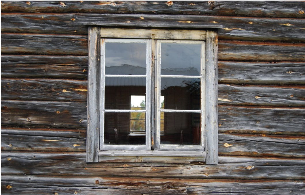
Figur 4. Samtliga byggnader på gården, utom arrendatorsbostaden, har grånade timmerfasader.