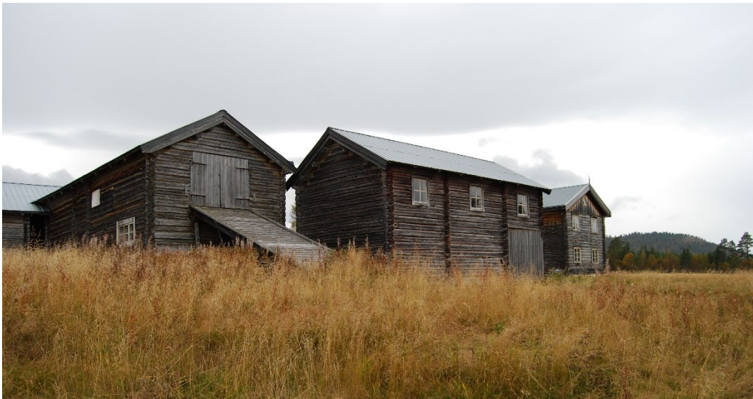
Figur 3. Gårdens bebyggelse ligger samlad i en löst sammansatt fyrkant.