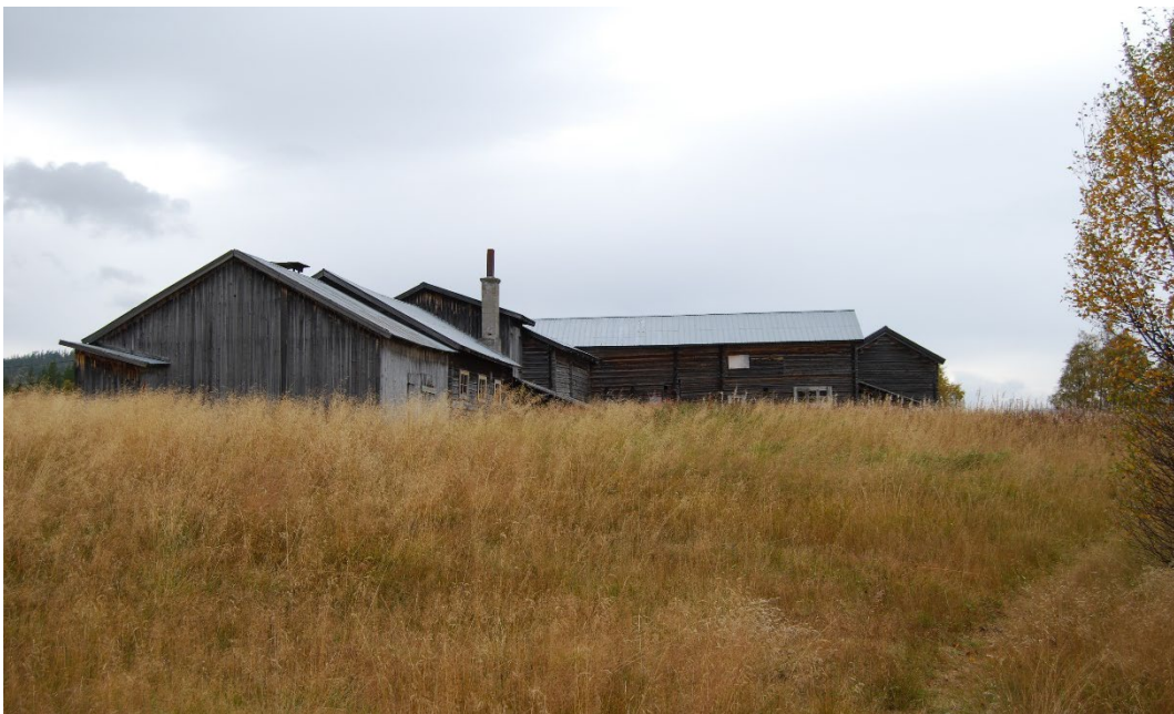
Figur 5. Lomviksgårdens bebyggelse sedd på håll.