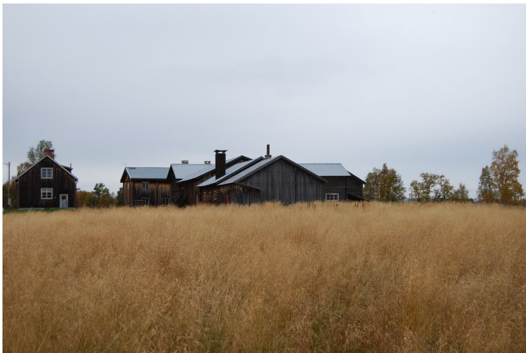
Figur 1. Lomviksgården ligger i ett öppet odlingslandskap.

Lomviksgården är belägen på södra stranden av gränssjön Flötningssjön (Storbosjön) i Älvdalens kommun, ca 600 meter från den norska gränsen. Det omgivande odlingslandskapet är öppet och storslaget. Gården består av en mangårdsbyggnad i två våningar, en sammanbyggd uthuslänga i timmer innehållande bodar, lador, loge, stall och lagård med mera samt en yngre arrendatorbostad. Byggnaderna är grupperade kring ett stort öppet tun i en upplöst fyrkant och med en del av uthuslängan utskjutande från den östra delen. I gårdsfyrkanten saknas den byggnad som Salmon Jonasson en gång använde som handelsbod.