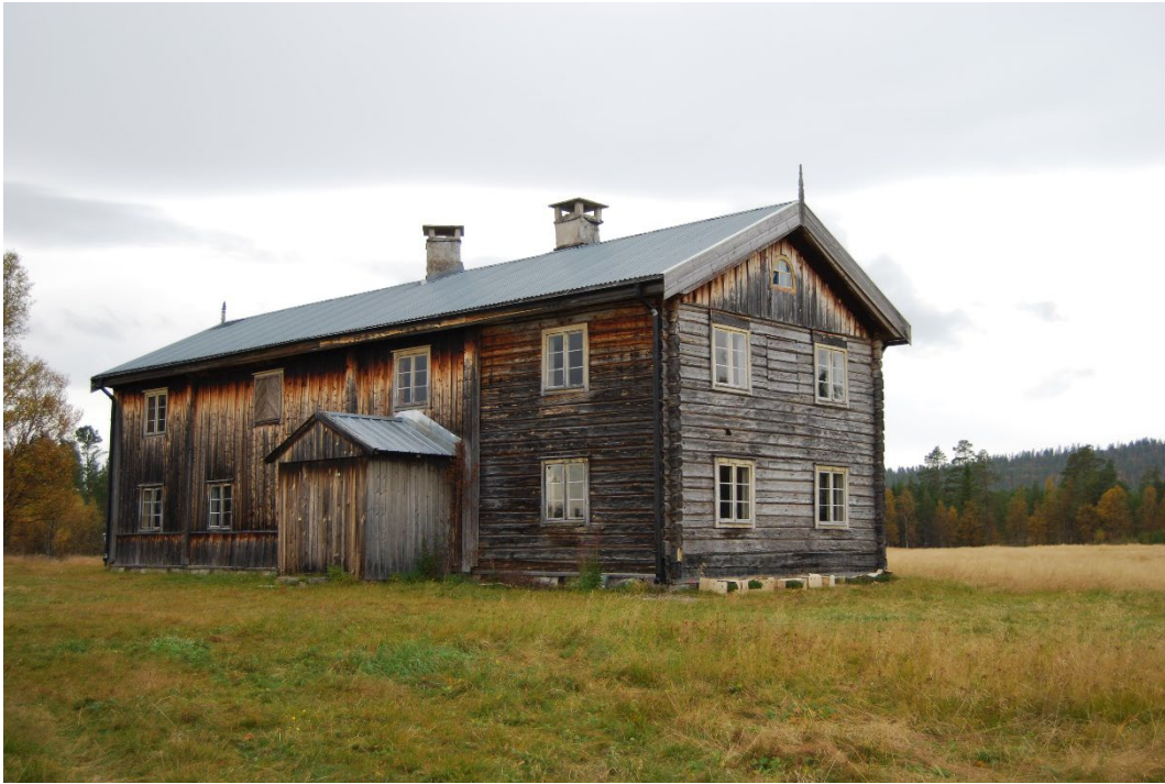
Figur 2. Mangårdsbyggnaden utgörs av en framkammerstuga med välbevarade interiörer.