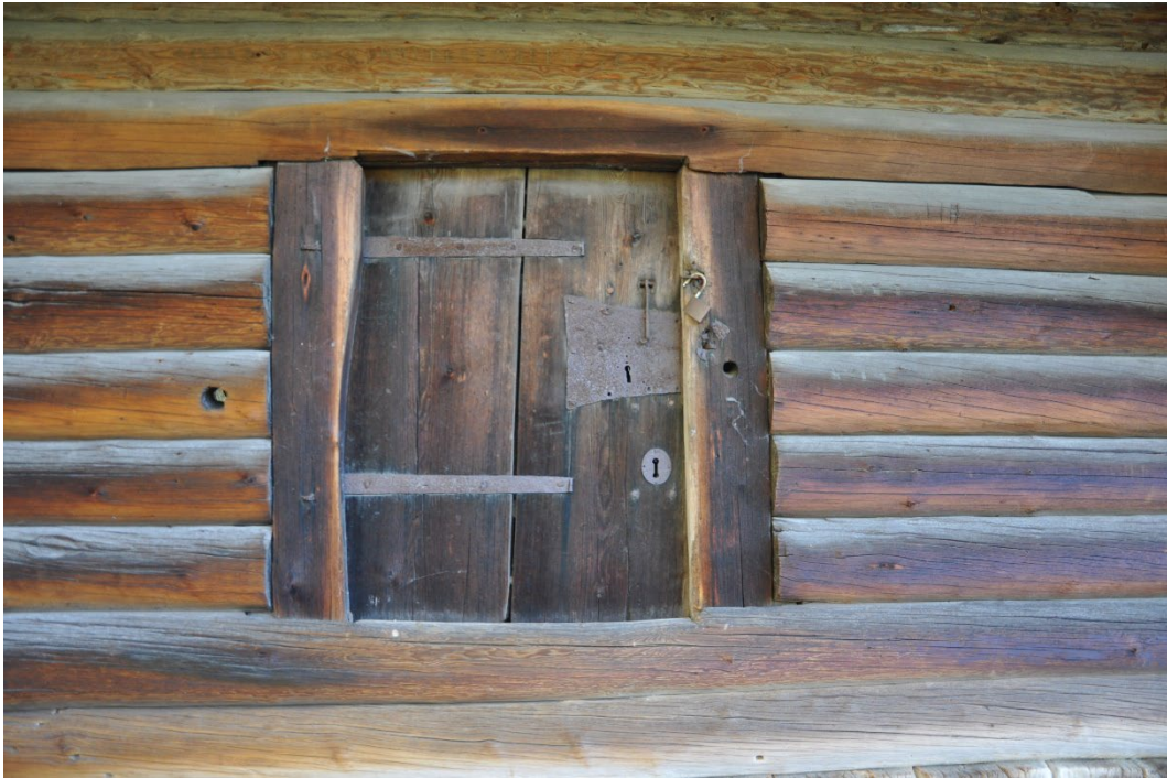
Figur 2. Bräddörr med bandgångjärn och draglås.