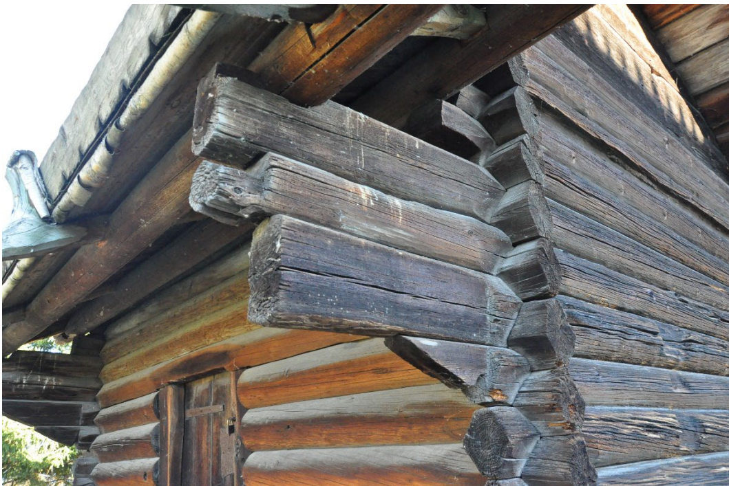
Figur 3. I sen tid har taksprånget vid ingångssidan kompletterats med konsoler av rundvirke