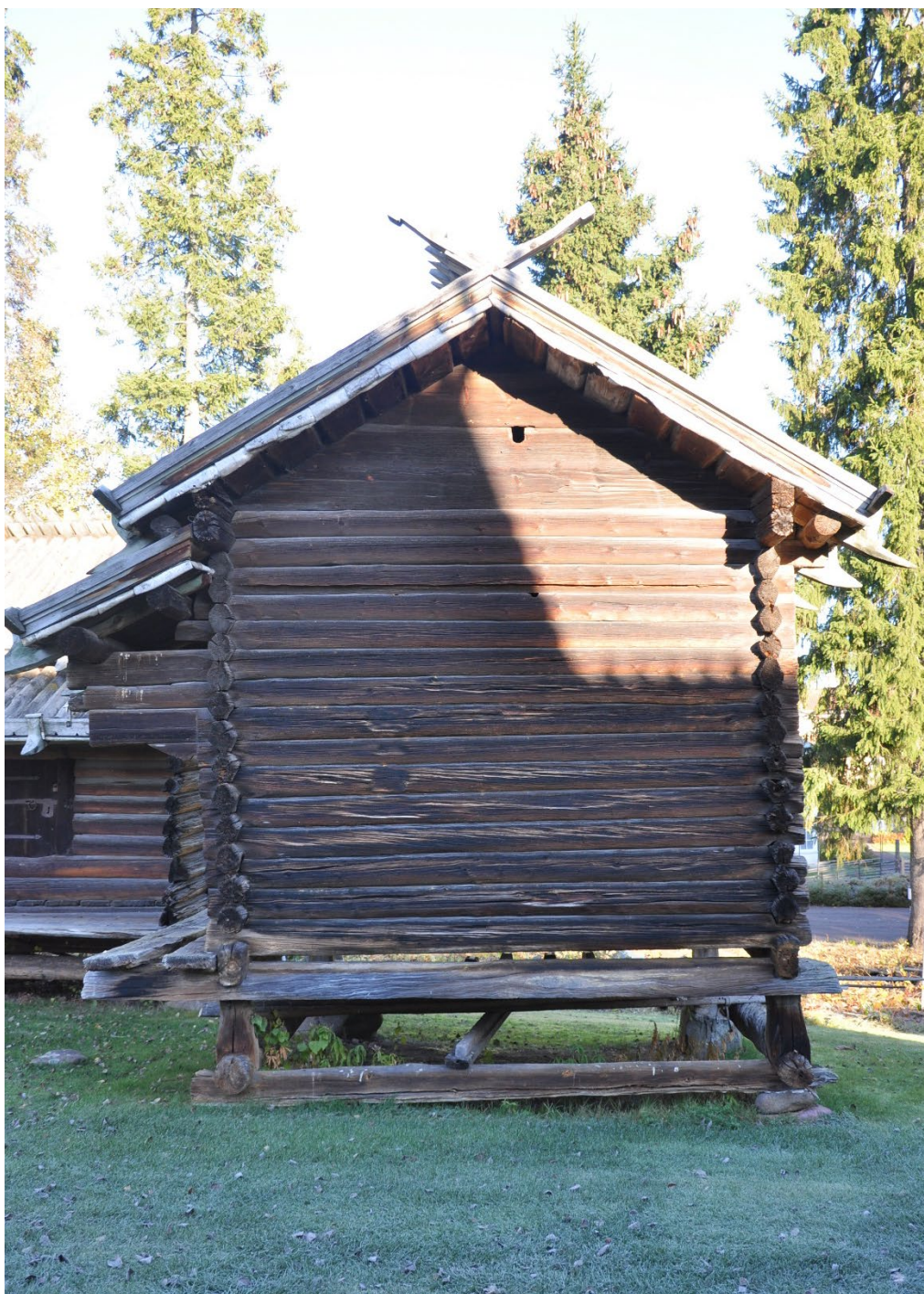
Figur 1. Stommen av rundtimmer har fogats samman med rännknutar. Knuthjässorna uppvisar en sexkantig form.