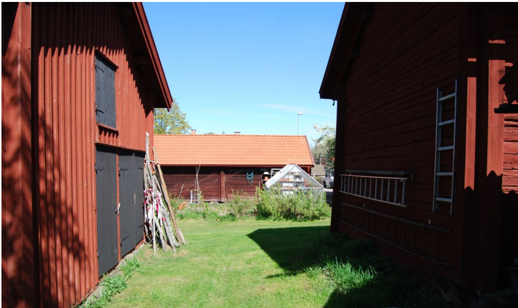
Figur 6. Kaptensgården är kringbyggd på tre sidor. Södra flygeln rakt fram, vagnboden till vänster, garage till höger.