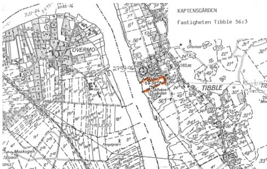
Figur 7. Situationsplan som visar fastigheten Tibble 65:3, med byggandsminnets skyddsområde markerat med orange linje. Ur beslut 1975.02.17.