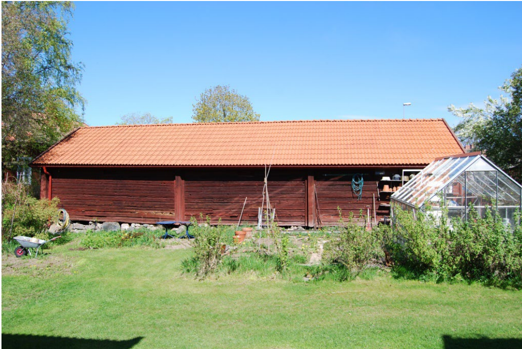
Figur 5. Södra flygeln, förrådsboden, sedd från vagnboden.