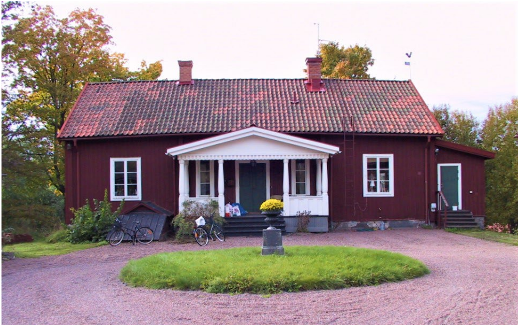
Figur 3. Bostadshuset har en dekorativt utformad veranda. Fasaderna är kända i locklistpanel och till höger syns vedboden.