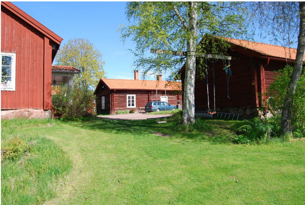
Figur 4. Bostadshuset till vänster, rakt fram norra flygeln och till höger södra flygeln.