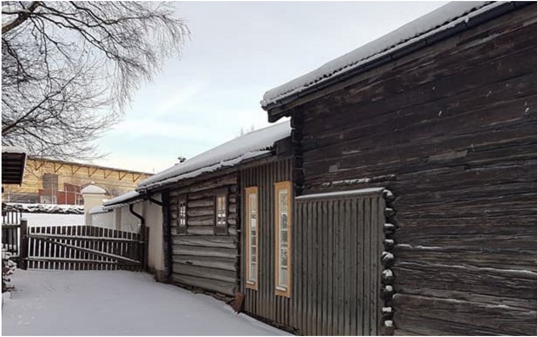
Figur 9. Uthusbyggnaderna i timmer är inköpta i närområdet och flyttade till platsen.