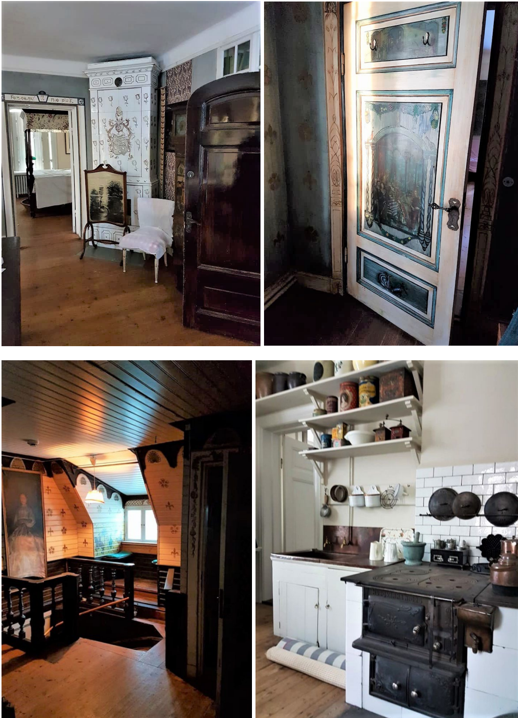
Figur 5 – 8. Vålbevarade interiörer i huvudbyggnaden. I huset finns välbevarade kulturhistoriskt intressanta interiöra detaljer, exempelvis trappräcket från 1600-talet och en 1600-talsdörr från godset Degla.