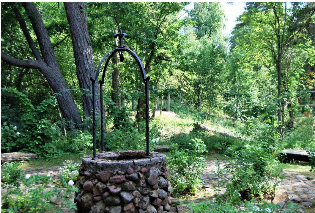
Figur 2 - 3. Delar av trädgårdsanläggningen som hör till Hildasholm, Hilda Munthe.