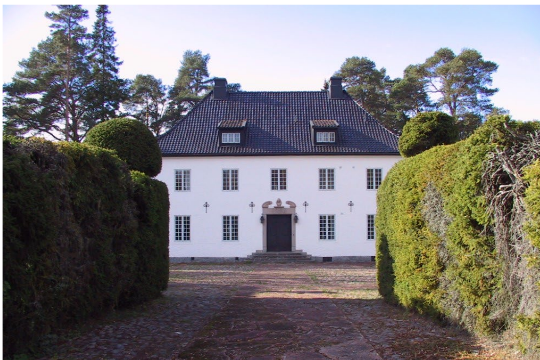
Figur 4. Hildasholms huvudbyggnad, med spritputsade fasader och synliga ankarjärn.

Inuti huvudbyggnaden ryms framför allt en stor mängd lösöre med anknytning till familjerna Pennington och Munthe. Dessutom finns interiöra detaljer av stort antikvitetsvärde inlemmade i husets funktioner. Av dessa kan nämnas ett handskuret trappräcke från 1600-talet och sex målade italienska pannåer från 1400-talet i ingångshallen. Musikrummet innehåller väggmålningar samt en 1600-tals dörr, räddad från det nedbrunna småländska godset Degla. Det angränsande Kapellet är dekorerat med väggmålningar av Viking Munthe. I Morgonrummet finns en dekorerad dörr från husets tillkomst.