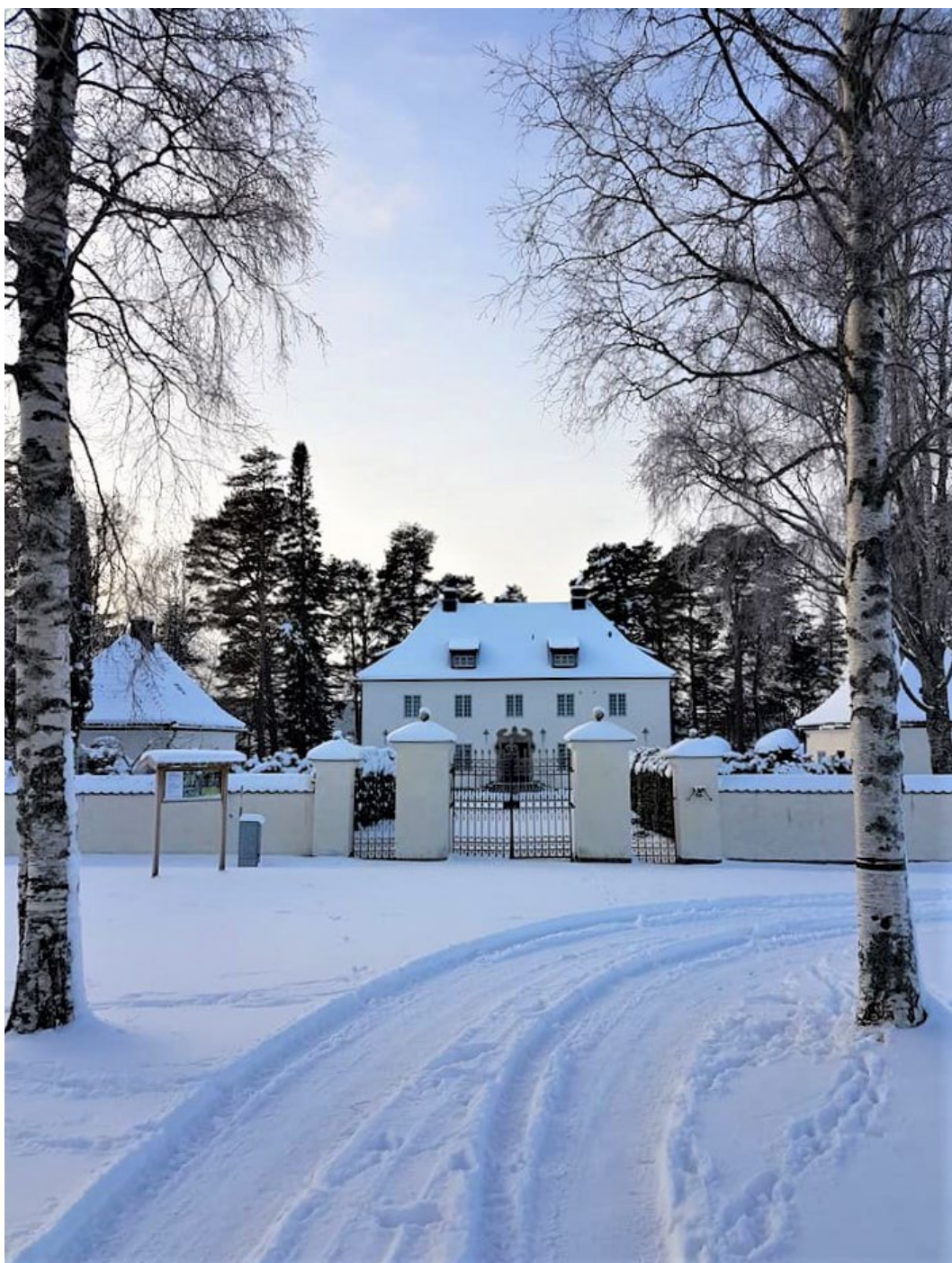
Figur 1. En björkallé leder upp till anläggningen Hildasholm.