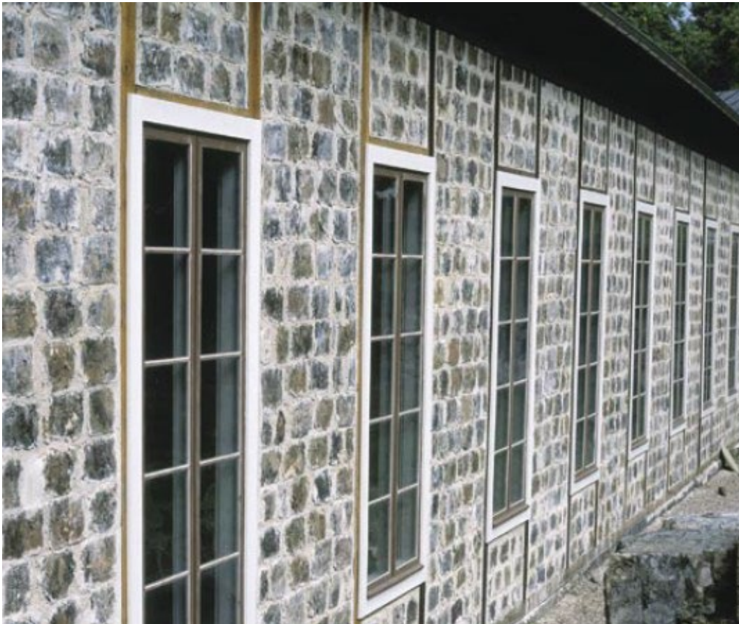
Figur 3. Smedjan är uppförd i murad slaggsten.