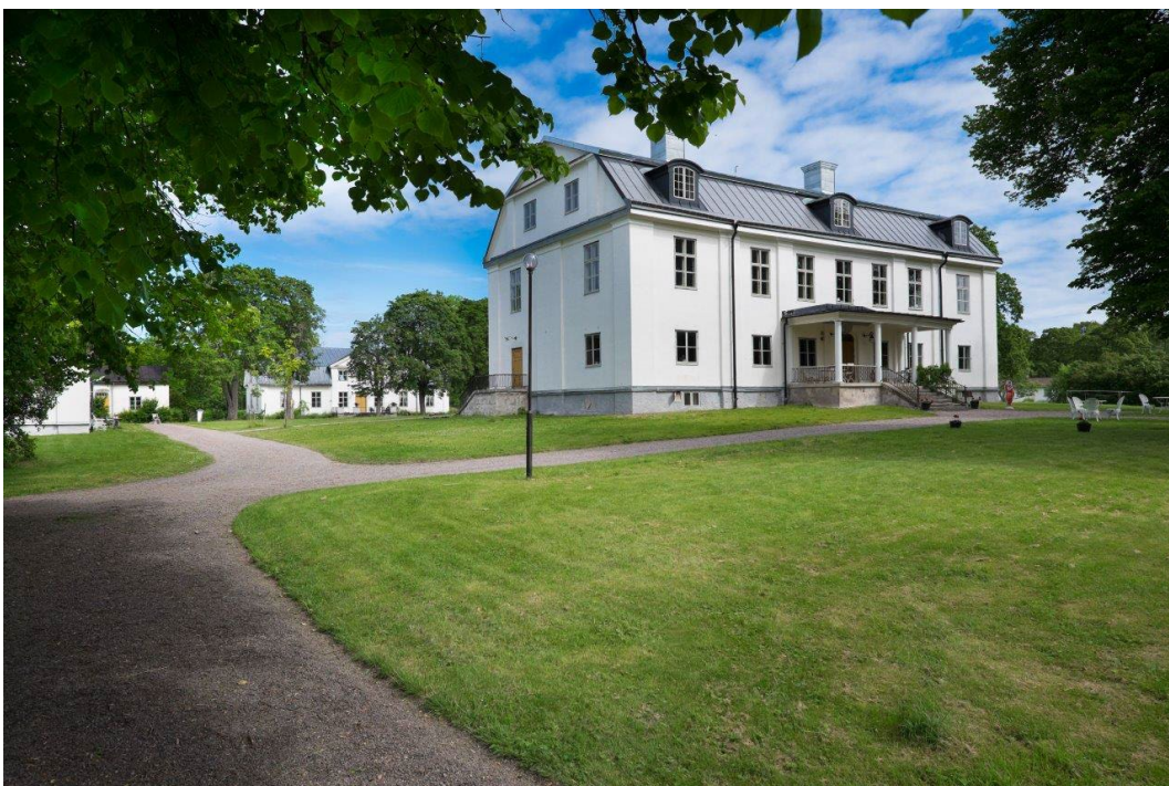
Figur 1. Stora herrgården. Bakom skymtar lilla herrgården, och till vänster Västra flygeln.

Polhems ättlingar ägde Stjärnsund fram till 1853. Därefter var det släkten Waern som ägde bruket till 1871, då det köptes upp av Klosters AB. År 1927 kom Stjärnsunds bruk att inlemmas i Fagerstakoncernen. Bruksverksamheten lades ned 1942. 1950 omvandlades herrgårdsanläggningen till pensionat, som fick gott renommé. Verksamheten bedrevs fram till 1974. I slutet av 1990-talet och början av 2000-talet har smedjan och Stora Herrgården i Stjärnsund genomgått omfattande renovering efter en längre tids förfall.