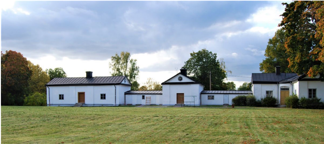
Figur 2. Herrgårdens flygelbyggnader bildar en för Dalarna unik kringbyggd gårdsmiljö.