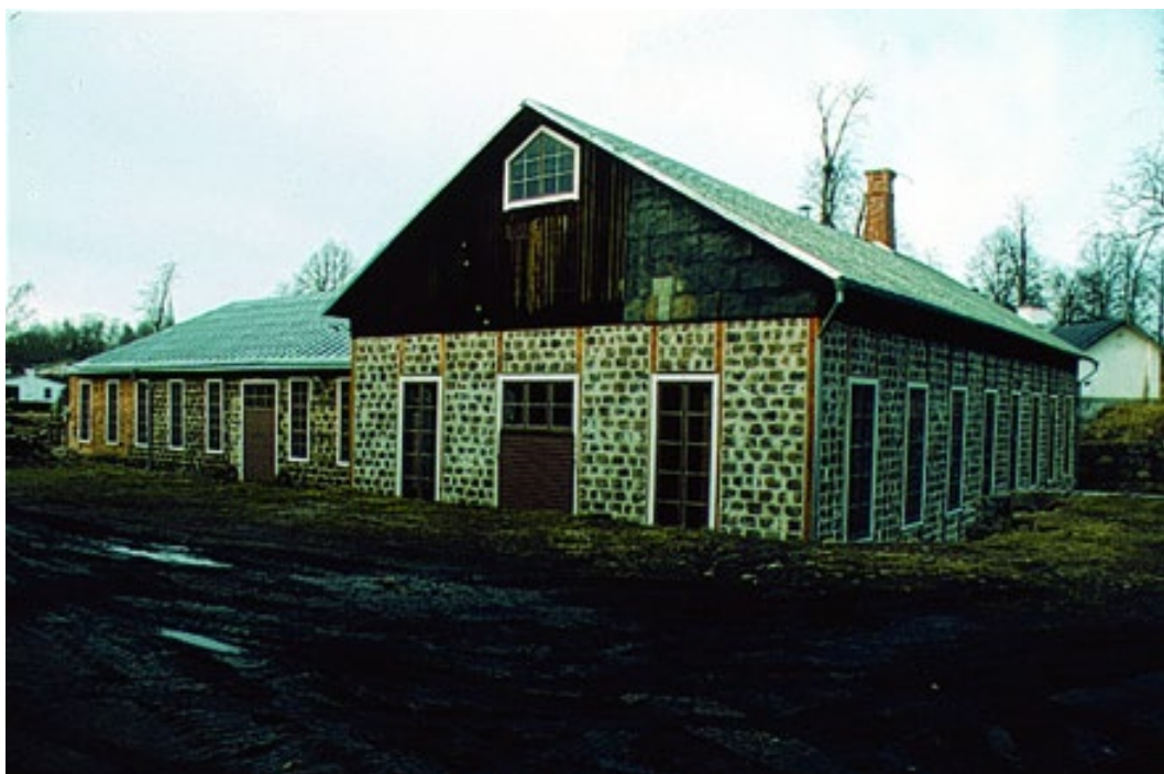
Figur 8. Smedjan.

Många av brukets byggnader är idag privatbostäder. Till herrgårdsområdet hör även flera uthusbyggnader såsom vagnslider, växthus, spruthus, svinhus och badhus.