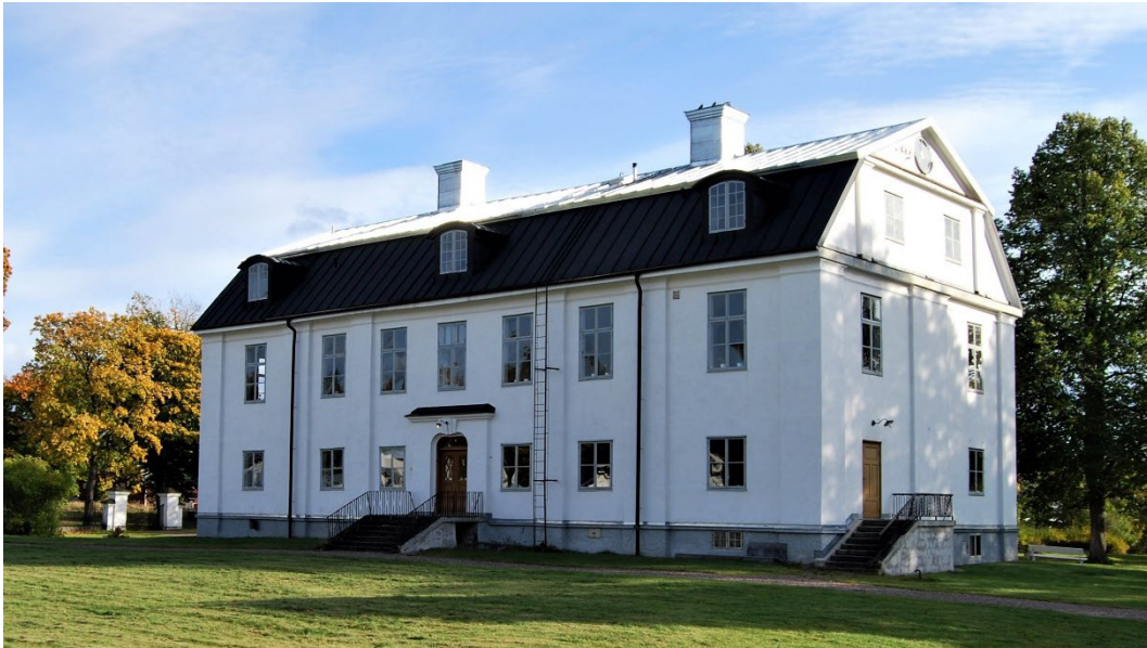
Figur 4. Huvudbyggnaden.