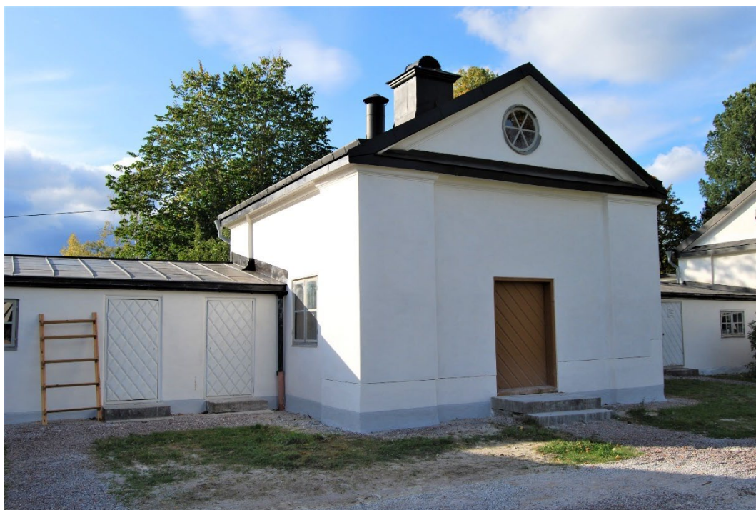
Figur 7. Bykhuset efter renovering.

Befallningsmansbostaden byggdes ursprungligen som stall men byggdes om enligt Ruckerschölds teknik, som en typ av prototypus innan herrgården uppfördes med samma teknik. Här bodde brukets befallningsman på 1900-talet, det vill säga arbetsledaren för jordbruket. Äppelbo och Pärönbo är två flyglar som ligger symmetriskt placerade på var sin sida om den nord-sydliga axeln. Äppelbo var ursprungligen inspektorsbostad och Pärönbo uppfördes som vagnshus, men byggdes senare om till bostad för brukets kusk och trädgårdsmästare.