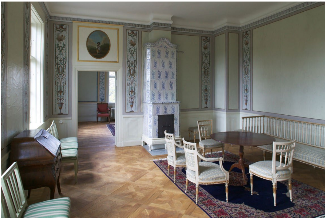
Figur 5. Förmaket i Stora Herrgården med 1700-tals kakelugn och väggmålningar i pompejansk stil av Nils Johan Asplind.