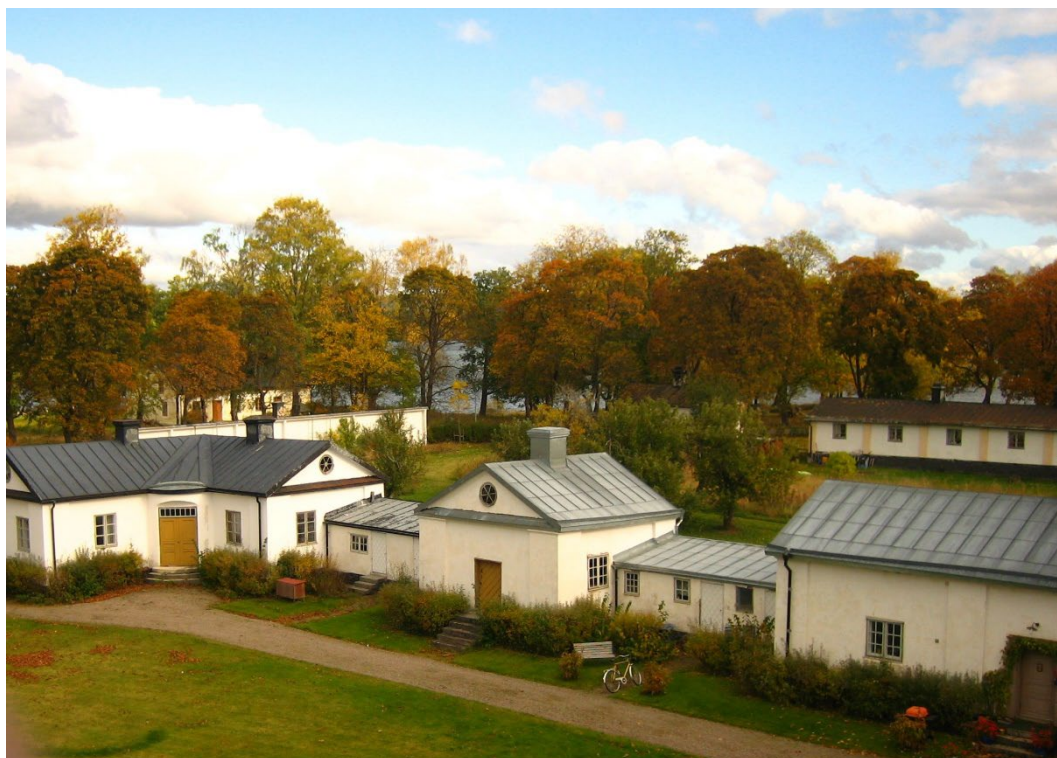
Figur 6. Herrgårdens flygelbyggnader har samma utförande som huvudbyggnaden.

Flygelbyggnaderna runt Stora herrgården uppfördes i huvudsak under andra hälften av 1700-talet, men fick sannolikt sitt slutliga utseende i början av 1800-talet. Flera av dem byggdes i samma, av Ruckersköld utvecklade byggt teknik, som Stora herrgården.