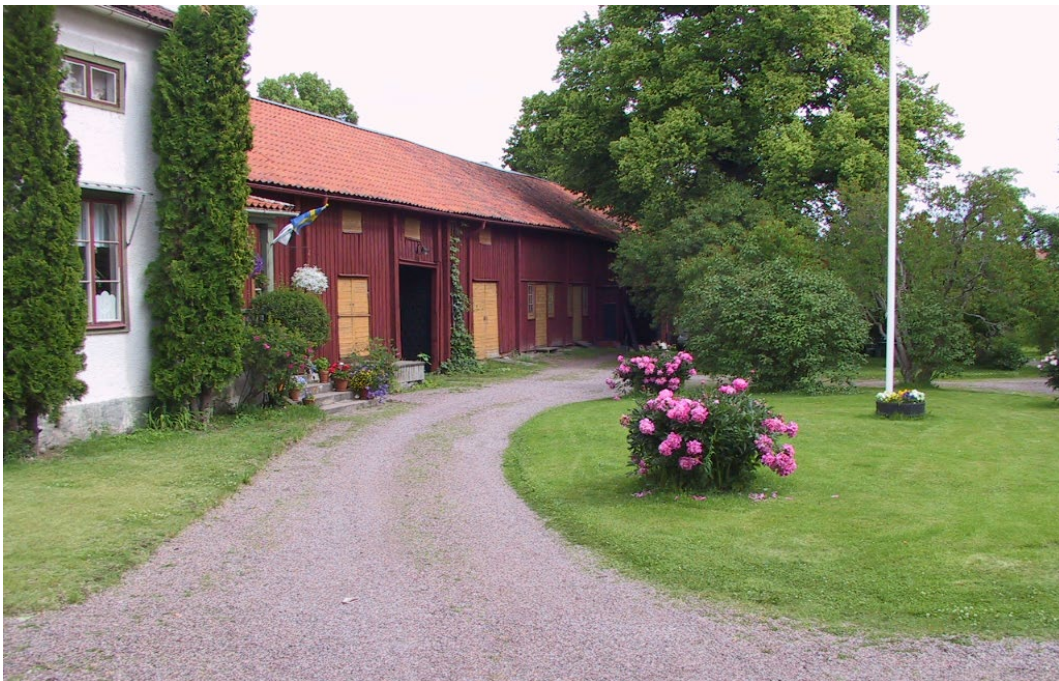
Figur 4. Inne på Perssonska gården finns ett vårdträd och en gräsbevuxen rundel. En mindre fruktträdgård hör också till fastigheten.