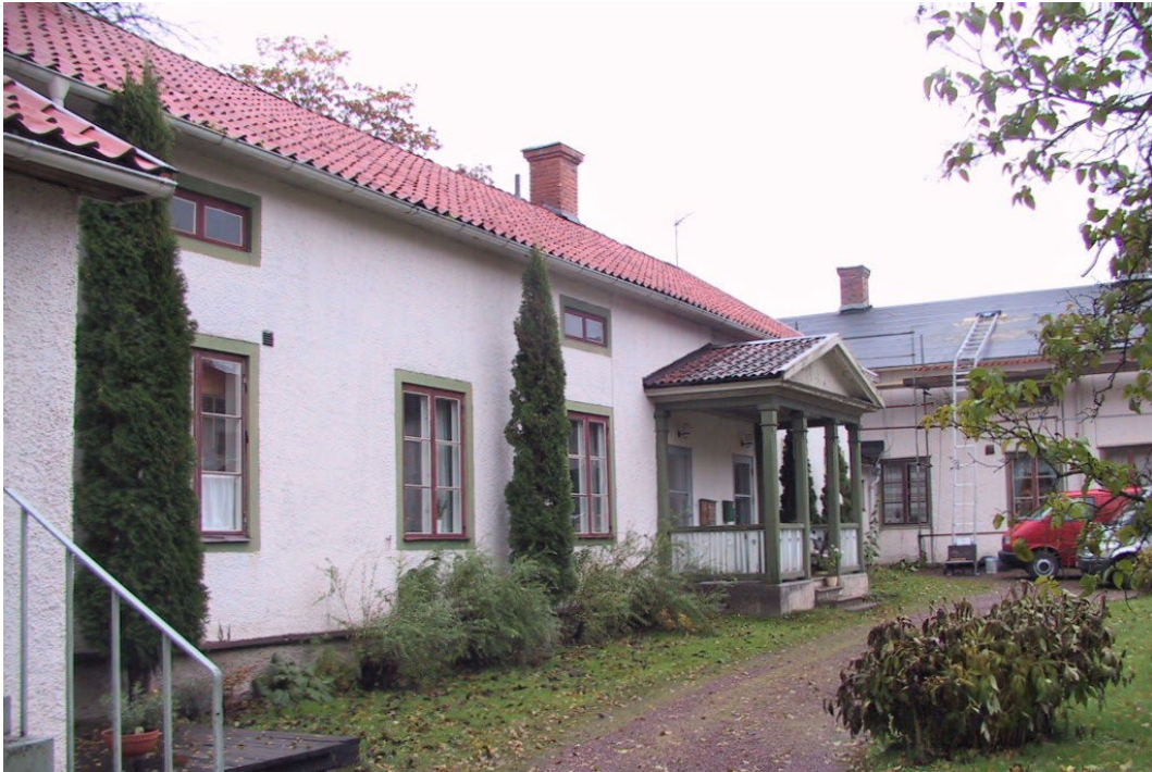
Figur 3. Bostadshus mot innergården.