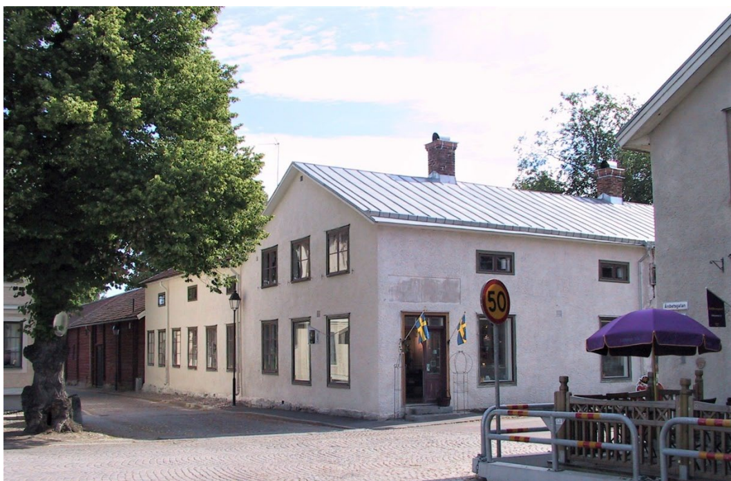
Figur 1. Perssonska gården i mötet mellan Fredsgatan och Kyrkogatan.

Perssonska gården är på tre sidor kringbyggd. Fastigheten gränsar mot Kyrko-, Freds-, Lands- och Gröna gatorna. Förutom butiks- och bostadshus finns ett flertal uthusbyggnader i form av stall, magasin, lada, tvättstuga mm. Uthusbyggnaderna är sammanbyggda i två längor som inramar gårdsplanen. På gården finns ett vårdträd och en gräsbevuxen rundel. En mindre fruktträdgård hör också till fastigheten.