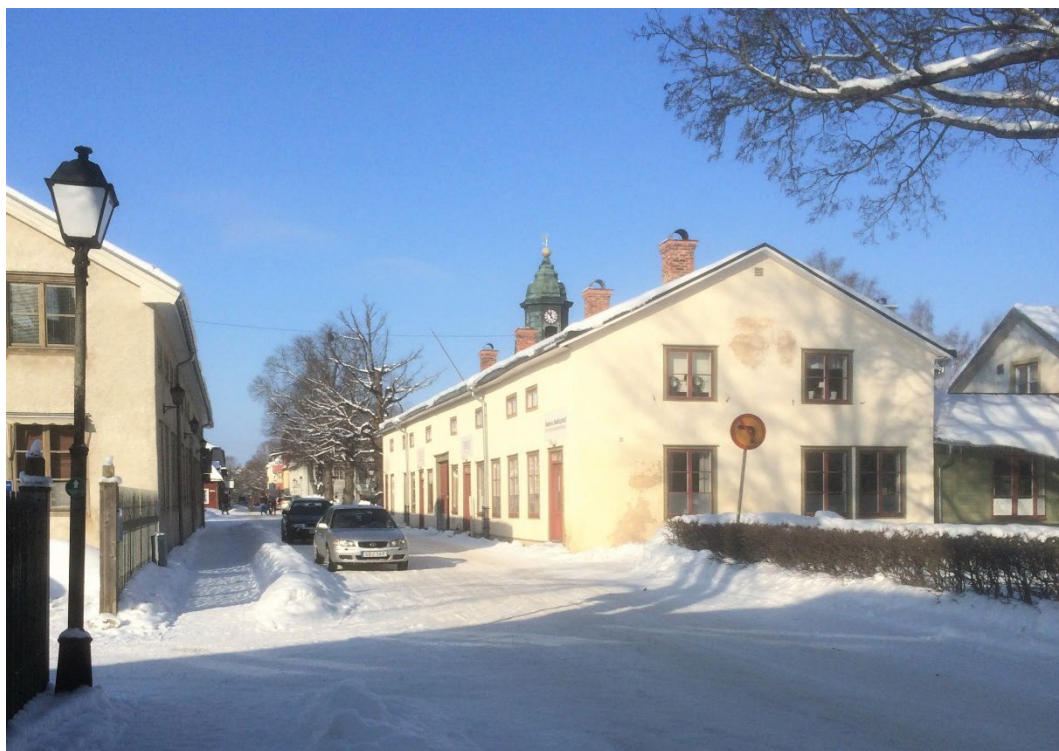
Figur 2. Butikslokaler mot Kyrkogatan. Foto: : Olle Lind, Länsstyrelsen i Dalarnas län.

Fastigheten är bebyggd redan på den äldsta stadskarta över Hedemora från 1642. Den välvda stenkällaren i butiks- och bostadshuset vid Kyrkogatan är sannolikt från 1600-talet.