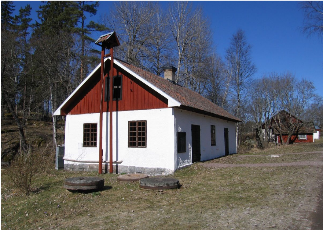
Figur 8. Klensmedja och snickeri.