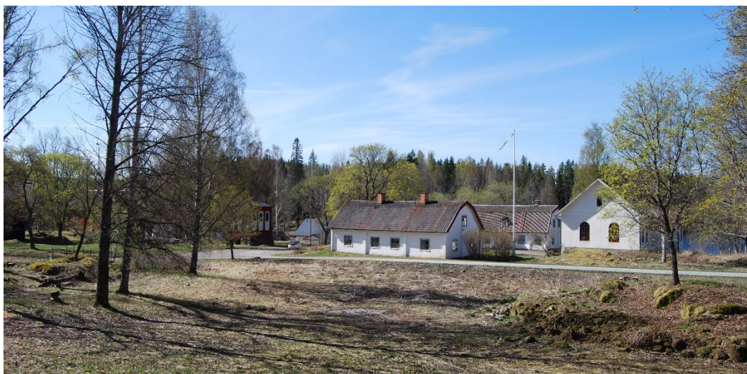
Figur 2. Herrgården, kyrkan och kontoret på Norns bruk. I bakgrunden skymtar Dammsjön.

Norns bruk är ett ensligt beläget före detta järnbruk mellan Hedemora och Söderbärke i södra Dalarna. Bruksbebyggelsen är grupperad längs med utloppet från Dammsjön till Stora Sundsjön. Utnyttjandet av höjdskillnaden mellan dessa sjöar för vattenkraft var en grundförutsättning för bruket. Bebyggelsen omfattar bland annat hytta, hammarsmedja, herrgård, kyrka, bruksarbetarbostäder och tillhörande uthus.