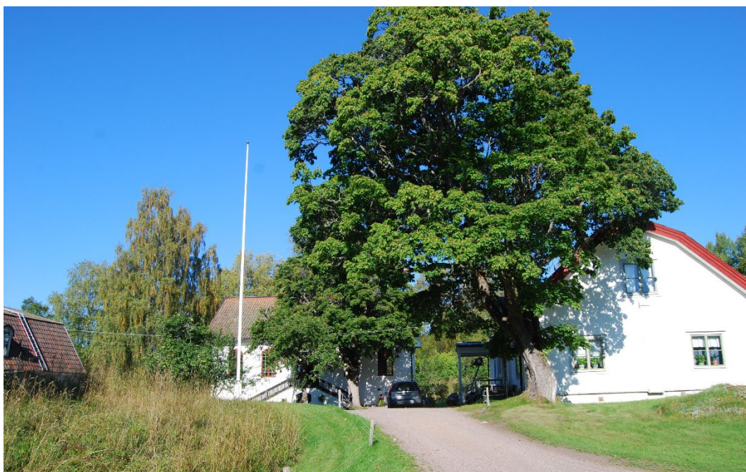
Figur 4. Prästgården och kapellet.