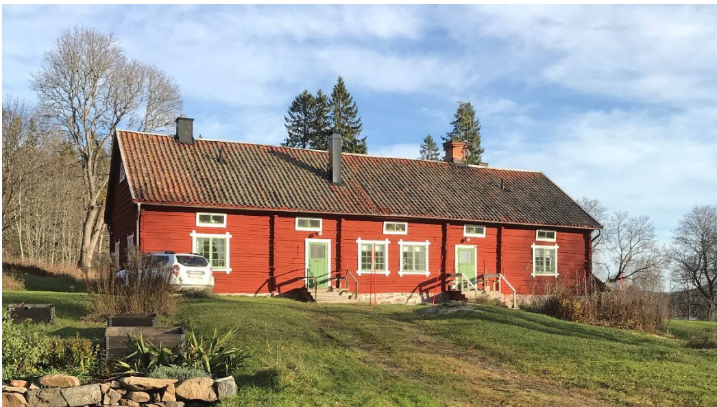
Figur 1. Norns bruk har en ovanligt välbehållen karaktär.

År 1966 kom Norn i Stora Kopparbergs Bergslags AB:s ägo. Under 1900-talet har bruket avfolkats och endast ett fåtal personer är numera permanent bofasta i Norn. Genom att bruket historiskt sett i huvudsak hållits samlat under en ägare har miljön bibehållit sin traditionella karaktär ovanligt väl.