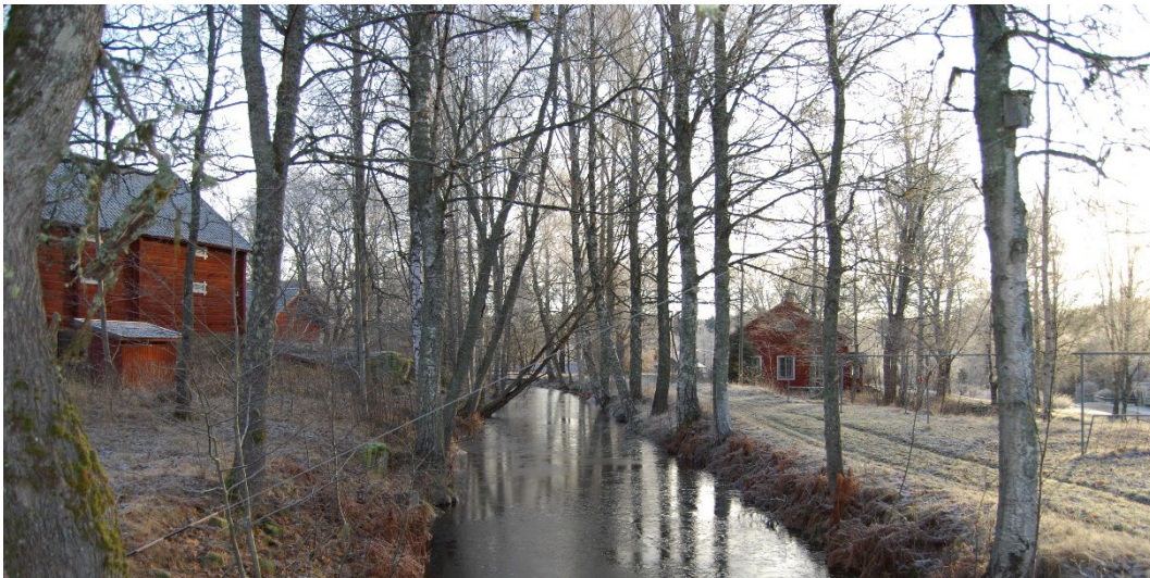
Figur 9. Höjdskillnaden mellan Dammsjön och Stora Sundsjön var en förutsättning för brukets etablering. Denna kanal tillkom i början av 1900-talet för ett elkraftverk.