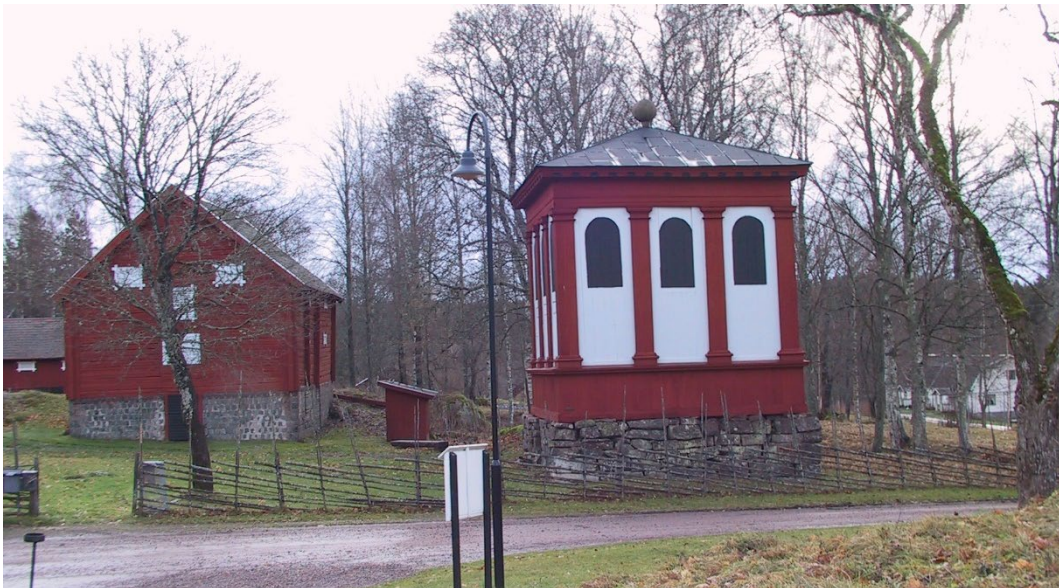
Figur 7. Magasinet och klockstapeln.