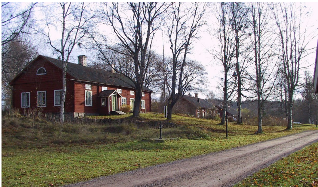
Figur 3. Rödmålade arbetarbostäder.