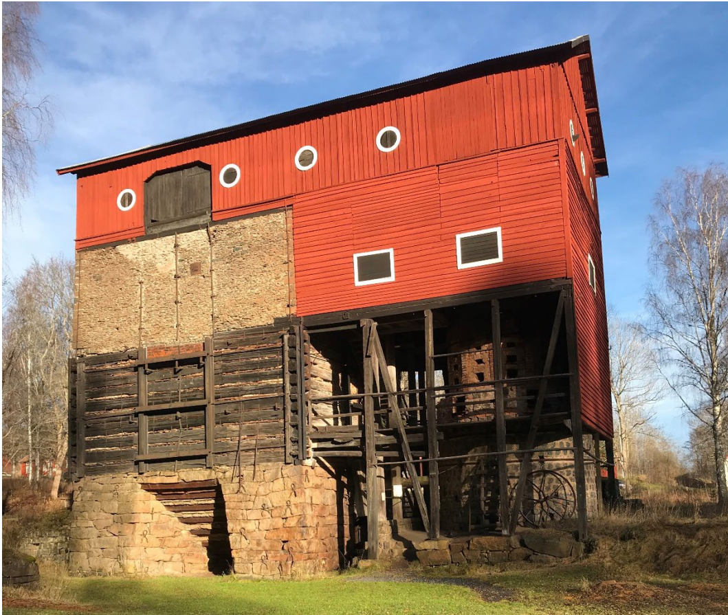
Figur 6. Hyttan.