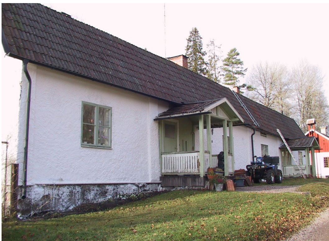
Figur 5. Smedbyggningen, uppförd 1699.