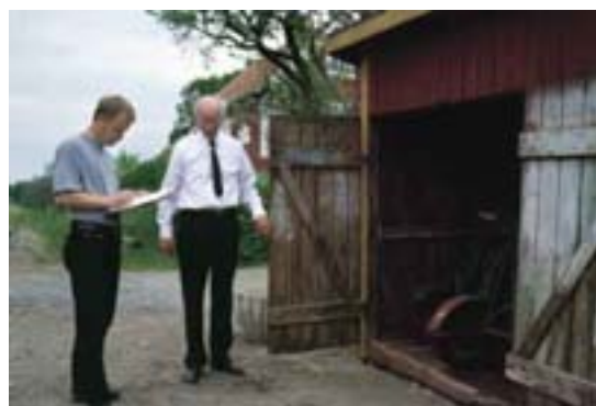
Kulturhistorisk dokumentation vid Anten-Gräfsnäs museijärnväg.

Hon pekar också på de goda exemplens möjlighet att skapa engagemang. I Västmanlands län har man i samarbete med landskapsvården, delat ut små medel till lantbrukare för att stödja olika mindre projekt, så som att rusta upp något kulturhistoriskt värdefull byggnad. Bidragen har givits ganska kravlöst utan några specifika antikvariska krav. Det är möjligt att fördela pengarna mellan flera mindre projekt. Av större fastighetsägare och fastighetsbolag kan man kräva att de ser efter sina "trappuppgångar" själva. Man skapar mer goodwill och engagemang genom att sponsra en bonde i Gullspång med 7000 kr för att lägga om taket. Det kan vara ett sätt att arbeta med de begränsade medel vi har.