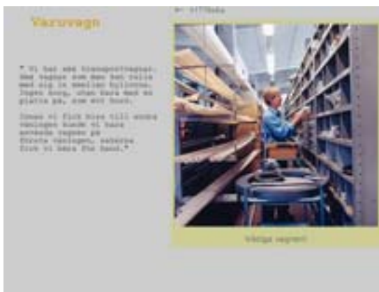
Varuvagn i materialförrådet - webbställningen vill med sina fotograferade föremål uppmana till kommentarer från besökarna.

När vi har utvärderat de arbetsmetoder som museet har prövat i projektet, så finner vi att de så kallade deltagande metoderna i insamlingen har varit berikande. Arbetssättet har gett nya infallsvinklar på dokumentation av en industrimiljö. De dialogiska metoderna har gett en mera förutsättningslös problematisering av föremålsinsamlingen och urvalsförfarandet. Museet har på samma gång fått ett intressant minnesmaterial om industriarbetet på en petrokemisk industri och om synen på det egna arbetet. Metoderna har också skapat ett större intresse för museets verksamhet ute i regionen, avslutar Christine Fredriksen.