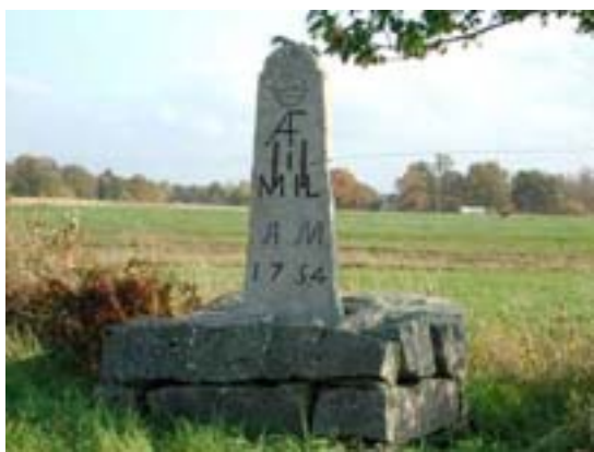
Genom samarbete mellan vägverket, länsarbetsnämnden, länsstyrelsen, hembygdsrörelsen, kommunen och länsmuseet har milstolpar i ett flertal kommuner dokumenterats och rustats upp.

27 år efter det att man inrättat länsantikvarier är utmaningen för oss på Riksantikvarieämbetet, länsstyrelsen och länsmuseum fortfarande att hitta ett fungerande samspel och en fungerande ansvarsfördelning. Naturligtvis ska vi samverka, men det finns också konkreta ansvarsområden som faller på