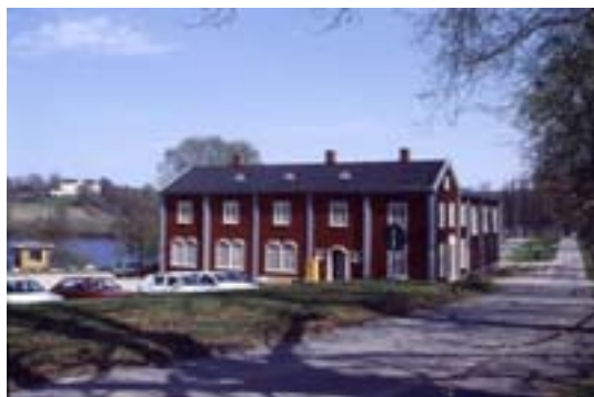
Till Byggnadsvård Nääs söker sig många som vill rusta kulturhistoriskt värdefull fastigheter.