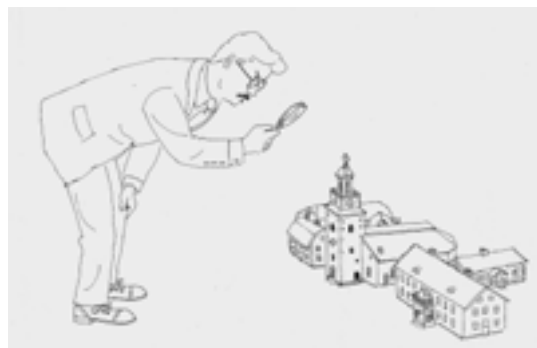
”Kulturvård från ovan”. Illustration av Harry Peterson, Grangärdeprojektet ©.

handlar om en abstrakt nivå gällande hustyper och liknande. Däremot har han inga lokalhistoriska kunskaper. De faktiska kvaliteter som identifieras idag kommer sällan fram eller kommer fram när det är för sent, t ex i samband med ett planarbete, då man tar ställning för eller emot något. I Grangärde var målsättningen att få fram dessa kvaliteter och kunskaper redan i arbetets begynnelse.