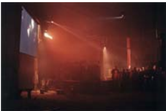
Bilder från den färdiga multimedia showen i smedjan.

projekt. Genomförandet tog inte mer än ett halvår, diskussionerna ett och ett halvt.