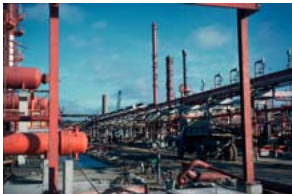
Den petrokemiska industrin skapar ett säregt industrilandskap – Nuvarande Arzko Nobel i Stenungsund på 1960-talet.

Ett första steg var att inrätta sk Arbetsplatsgrupper. Då ålder, kön och position ofta styr vad som är att betrakta som viktigt, försökte man att ”mixa” grupperna med avseende på dessa faktorer. Grupperna var tolv till antalet och sammanträdde några gånger för att diskutera frågor ss: Vad är kulturarvet i den petrokemiska industrin, vad ska vi samla in till museerna? Vad finns det för kulturarv i Stenungsund och vid den petrokemiska industrin? Vad tycker ni som arbetar i den petrokemiska industrin är viktigt att minnas om orten i framtiden? Ämnen som värderingar och framtid var känsliga och viktiga att diskutera. Processen krävde att de medverkande samlade sina tankar. För att de skulle kunna associera fritt hade varje möte ett omfattande tema. De teman som samtalen kretsade kring var: arbetsdagen, förändringar av arbetet, trivsel, globalisering, hälsa, demokrati, arbetskultur och framtiden. Utöver diskussionerna i arbetsplatsgrupperna, har museet haft ett utbyte med seniorföreningarna vid företagen och med Stenungsunds skola.