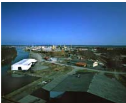
Utsikt över Stallbacka industriområde i Trollhättan.