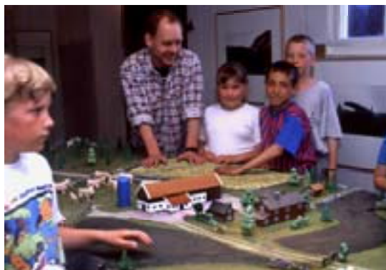
Skolbarn lär sig se landskapets historia genom Regionmuseum Västra Götalands vandringsutställning "Spår i landskapet – vrid historien tillbaka".