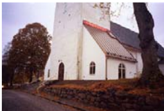
Den färdiga tillbyggnaden.

Ulricehamns kommun delar varje år ut ett pris/stipendium till Årets hus. År 2002 tilldelades priset Ulricehamns kyrka. I motiveringen kunde man bl a läsa att man visat prov på god stilkänsla och att man lagt stor möda på detaljer och utformning. Även de flesta Ulricehamnsbor var nöjda med ombyggnaden. Arkitekten lyckades utnyttja utrymmet till max och de flestas behov blev tillgodosedda, med handikapptolett och dyl.