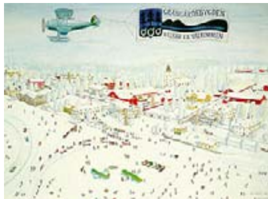
Kyrkebyn från ovan – vinter, akvarell, Harry Peterson ©

levelsemässiga och sociala företeelser. Nyttan med projektet, ur politiskt perspektiv, var att undersöka om man kunde finna nya metoder för ökad