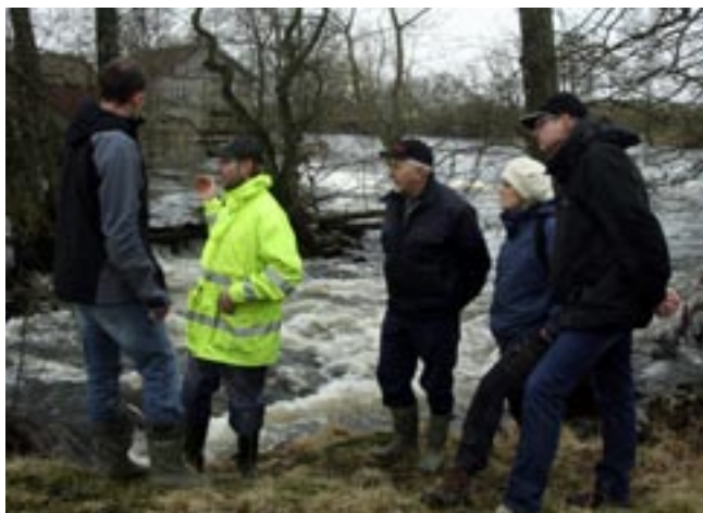
9 MARS KL 11.15: Biologer från länsstyrelserna i Västra Götalands och Hallands län diskuterar framtida fiskevård med markägare längs Rolfsån. Åns vattensystem sträcker sig över länsgränserna, därför är samarbetet mellan de två länsstyrelserna viktigt.

2006 påbörjade Länsstyrelsen arbetet med att förbättra fisketillsynen i Vänern. Genom tydlig och enkel information om de regler som omgärdar fisket ska vi se till att fiske med olika inriktningar kan ske under ordnade former. Under det gångna året har vi byggt upp en lokalt förankrad tillsynsorganisation. Lokala tillsynsmän kommer under året att börja arbeta i sex områden i Vänern.