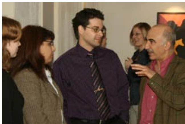
15 FEBRUARI KL 15.55: Konferens på Länsstyrelsen i Göteborg – tema nyanlända. Länsstyrelsen samarbetar med regionala aktörer och kommuner för att samordna och effektivisera nyanländas etablering i länet.

2007 fick länsstyrelserna ett så kallat demokratiuppdrag av regeringen som handlar om att öka kunskapen om de mänskliga rättigheterna. Under året kommer vi att bygga upp en egen kompetens inom området, för att på sikt