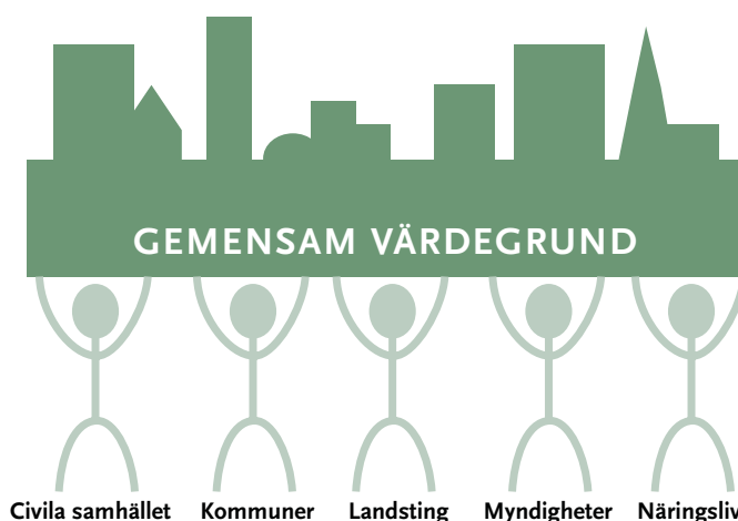
Risk- och sårbarhetsanalysen

En viktig utgångspunkt för Västra Götalandsmodellen är att man först övergripande identifierar vad som är skyddsvärt i samhället. Denna identifiering sker med fördel i tvärasektoriella grupper eller råd. I detta arbete bör ni utgå från värdegrunder i form av visioner eller liknande, för att ni ska kunna identifiera vad som anses vara skyddsvärt; om ni inte vet vad man ska skydda är det svårare att identifiera varningssignalerna och de potentiella hoten.