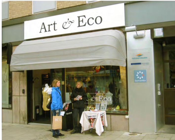
En mycket see- aktiv modebutik som bara säljer ekologiska, rättvisemärkta och begagnade mode kläder