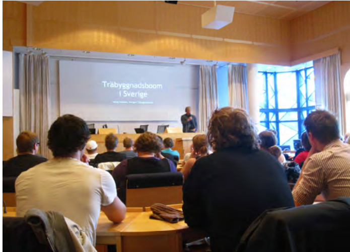
Seminarium om hållbart byggande