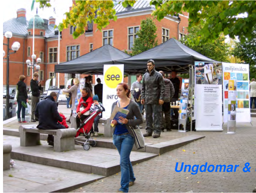
Ungdomar & unga vuxna