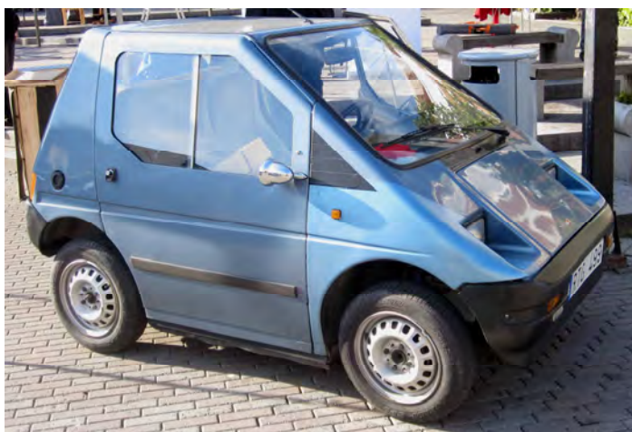
Håkans norska elbil från 1993 dagens publik- och mediafavorit på Rådhusorget