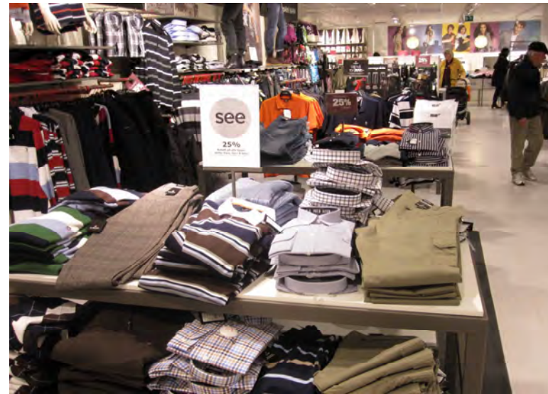
En stor klädkedjebutik erbjöd 25 % rabatt på standardkläder på skylt med see- logga