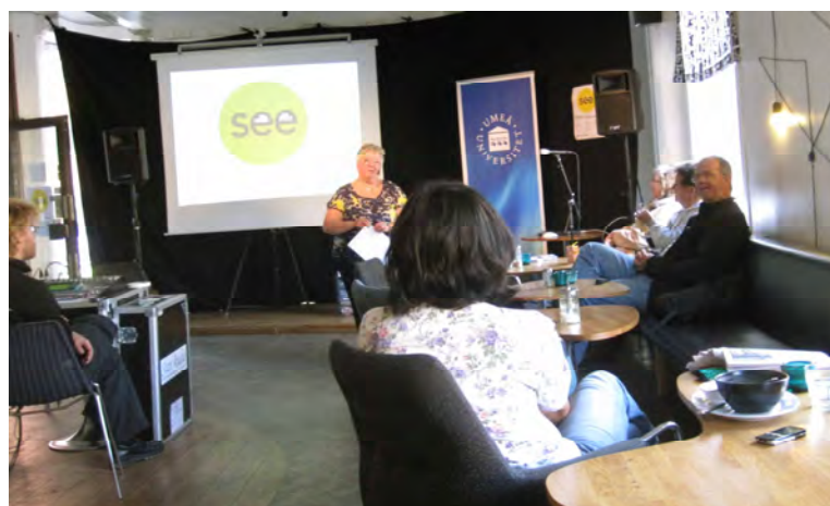
Landstingets och universitetets lunchföreläsningar om sex & droger, resp. om regnskogar på Café Schmäck