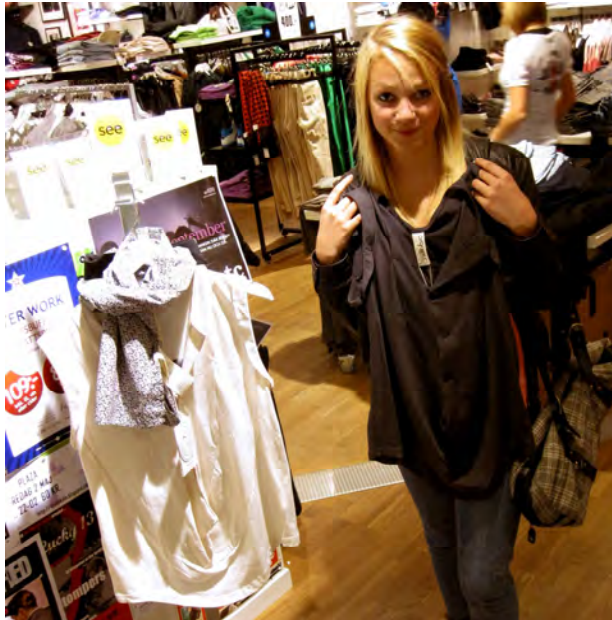
see- aktiv modebutik med några t-shirts i ekologisk och rättvisemärkt bomull