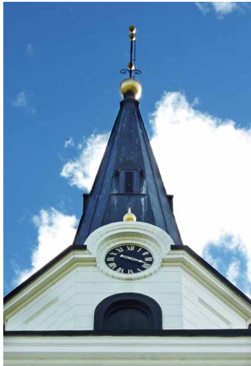
Landsförsamlingens kyrka, Skellefteå.

Länets två kulturreservat är mycket typiska och representativa för Västerbottens kulturhistoria. Länets reservat är unika i den me-