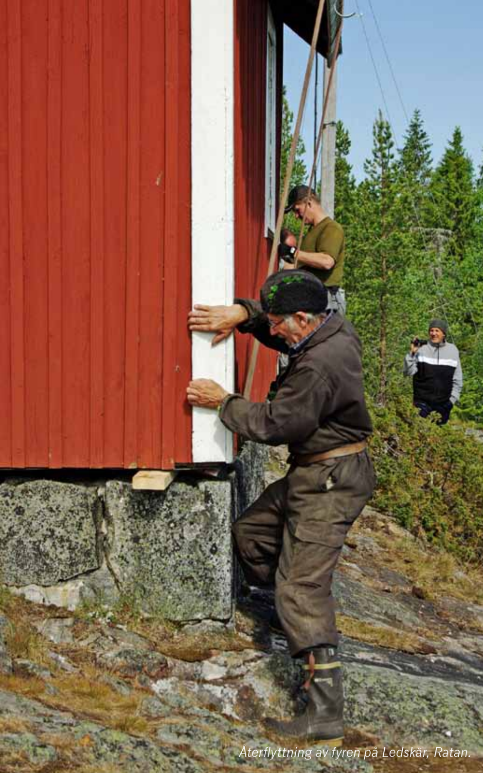
Återflytning av fyren på Ledskär, Ratan.