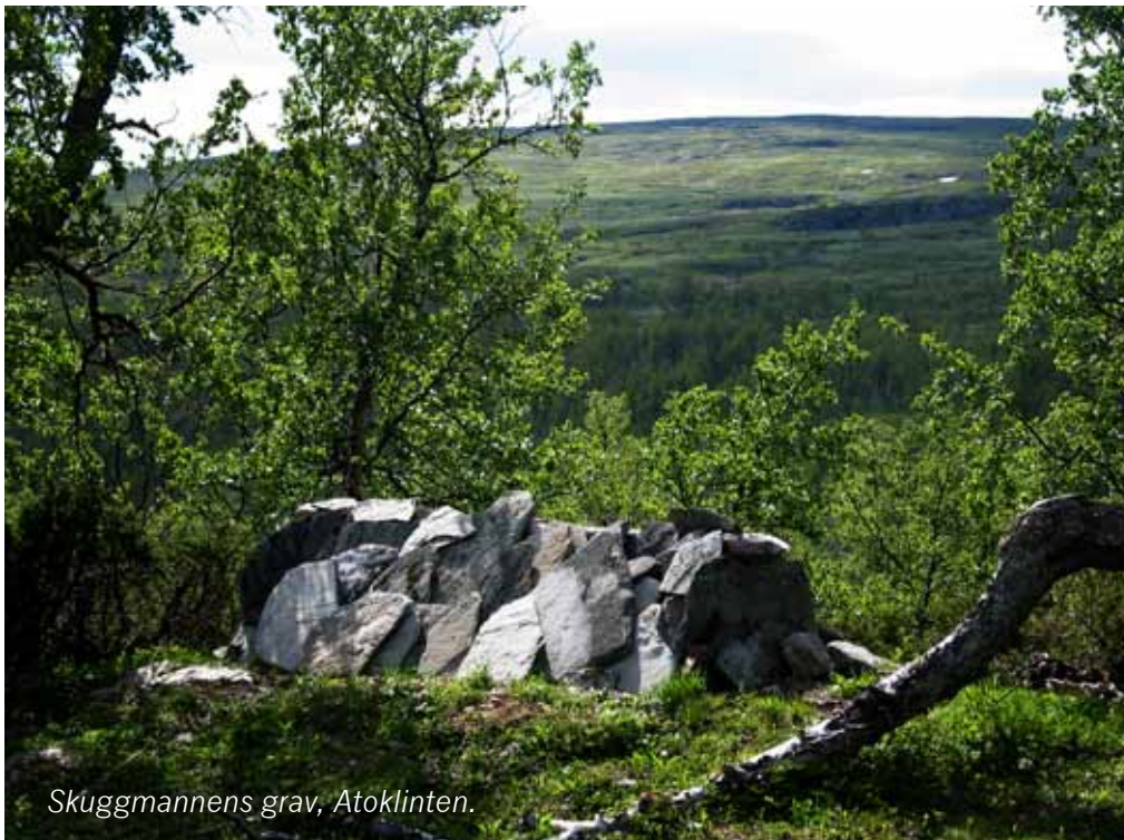
Skuggmannens grav, Atoklinten.