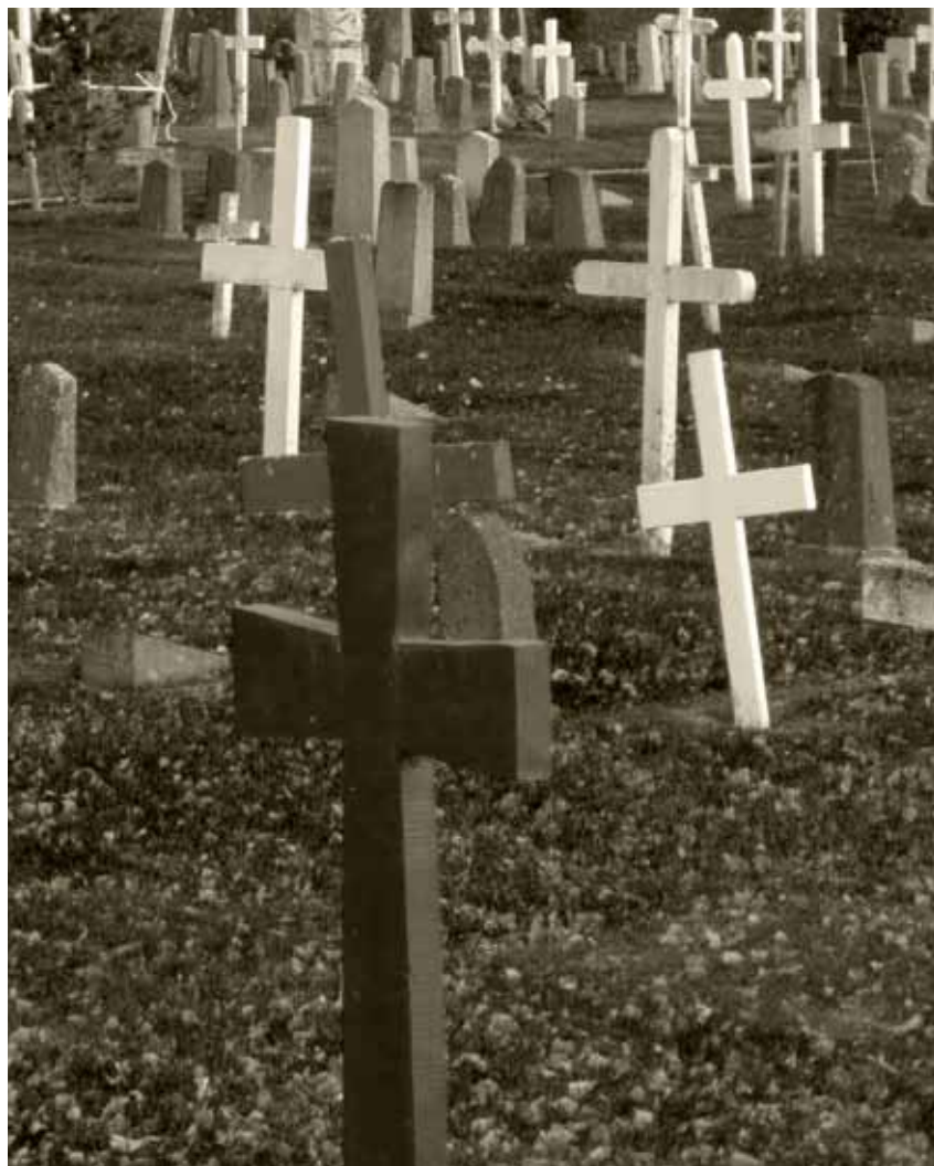
Begravningsplatsen vid landsförsamlingens kyrka, Skellefteå.

ningen att inga andra liknande kulturresevat finns i landet. Den framtida skötseln för länets två kulturresevat är säkrad så länge de nuvarande anslagen för kulturmiljövård finns. Kostnaderna för förvaltning och skötsel av de två resevaten är förhållandevis låga i