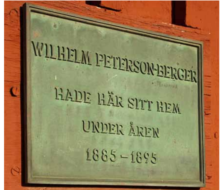
Byggnadsminnet Kungsgatan 97, Umeå.

Riksdagen har beslutat att det övergripande målet för miljöpolitiken är att vi till nästa generation ska lämna över ett samhälle där de stora miljöproblemen är lösta. Utöver generationsmålet finns sexton nationella mål för miljön med preciseringar och etappmål. Nio av dessa sexton miljö kvalitetsmål har direkt betydelse för arbetet med kulturarvet. I det regionala arbetet med miljömålen har Länsstyrelsen en samordnande roll. Länsstyrelsen ska tillsammans med kommuner, näringsliv, frivilliga aktörer och andra regionala myndigheter arbeta för att miljömålen får genomslag i länet och att miljötillståndet blir bättre. För kulturmiljöverksamheten innebär det att vi ska uppmärksamma den historiska mångfalden i landskapet, arbeta för att skydda, förvalta och utveckla värdefulla kulturmiljöer och att vi ska följa utvecklingen av kulturmiljötillståndet.