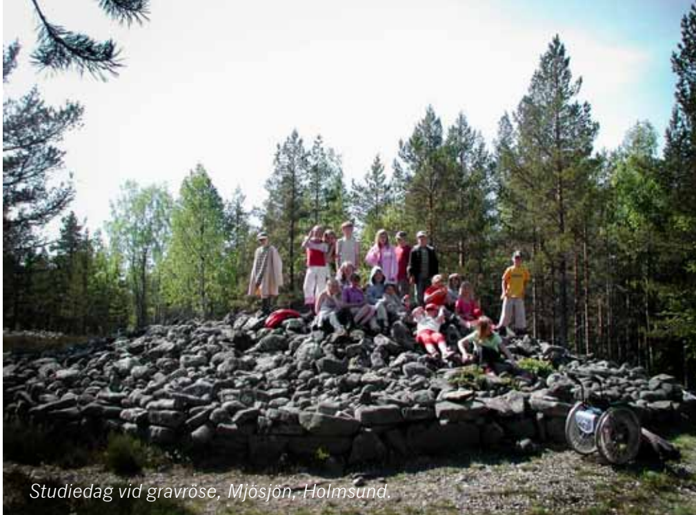
Studiedag vid gravröse, Mjösjön, Holmsund.