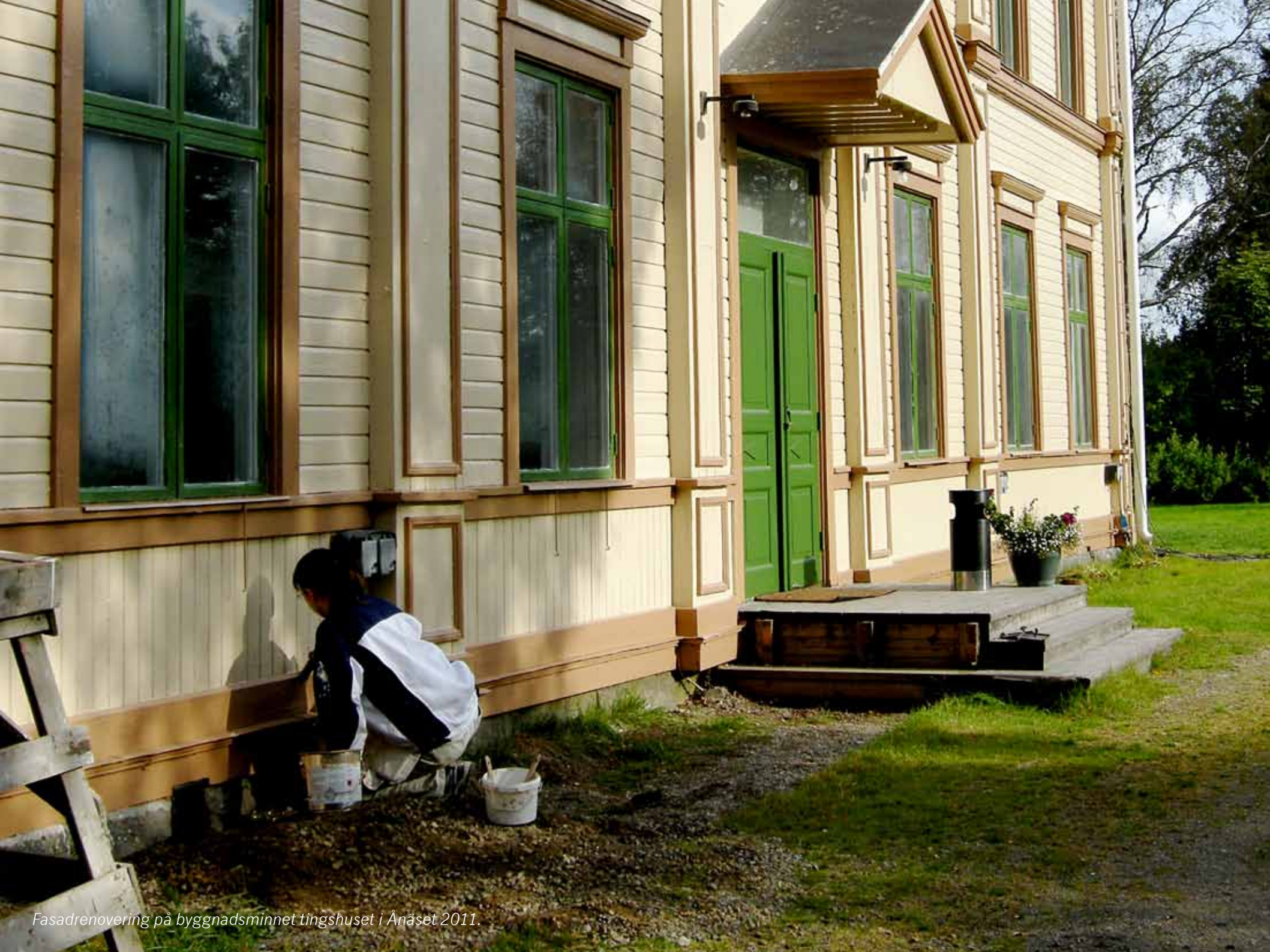
Fasadrenovering på byggnadsminnet tingshuset i Ånåset 2011.