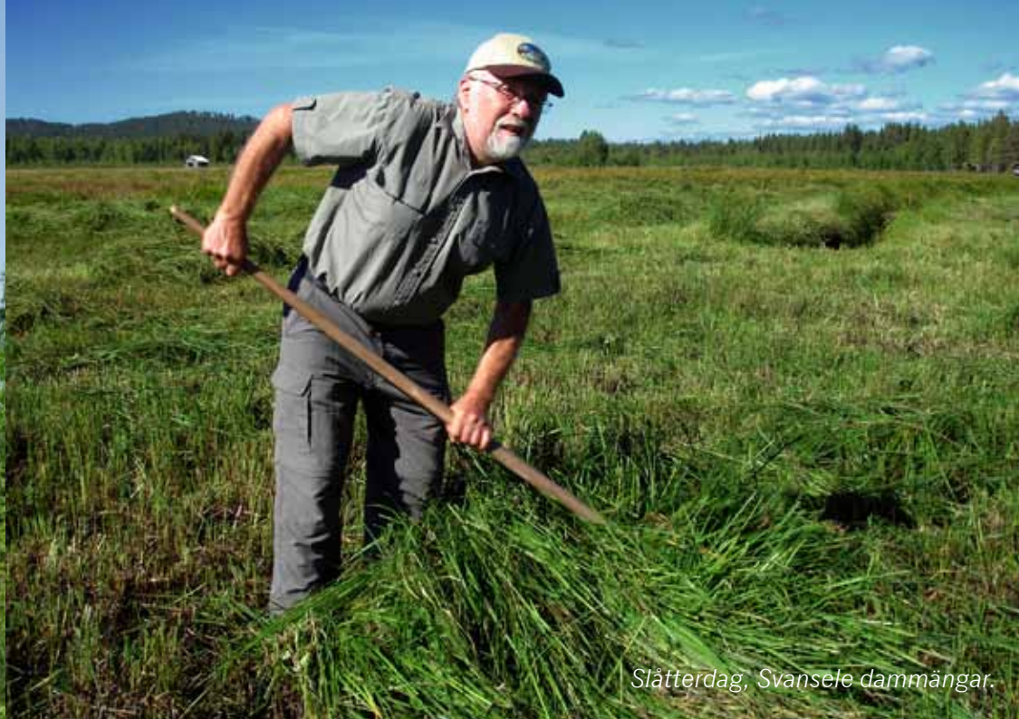
Slätterdag, Svanselse dammängar.