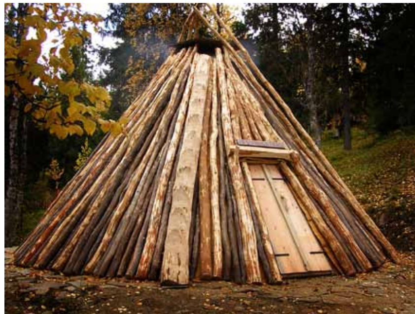
Visningskåtan i Fatmomakke.