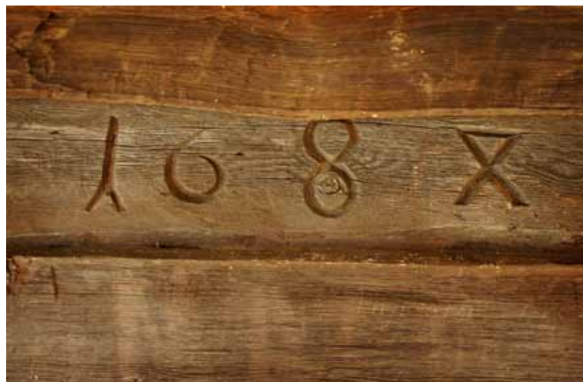
Härbre i Örträsk.