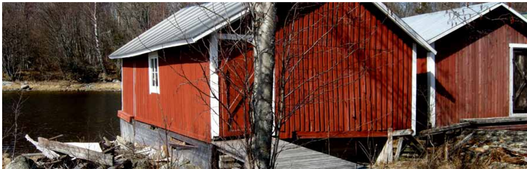
Fiskeläget vid Tannskärsviken, Norrbyskäer.

2010 genomfördes en förstudie för utveckling av en plats som ingår i Sevärt. Förstudien utgick från en utvald destination, fick namnet KulNaTur/Bjuröklubb och hade två syften: