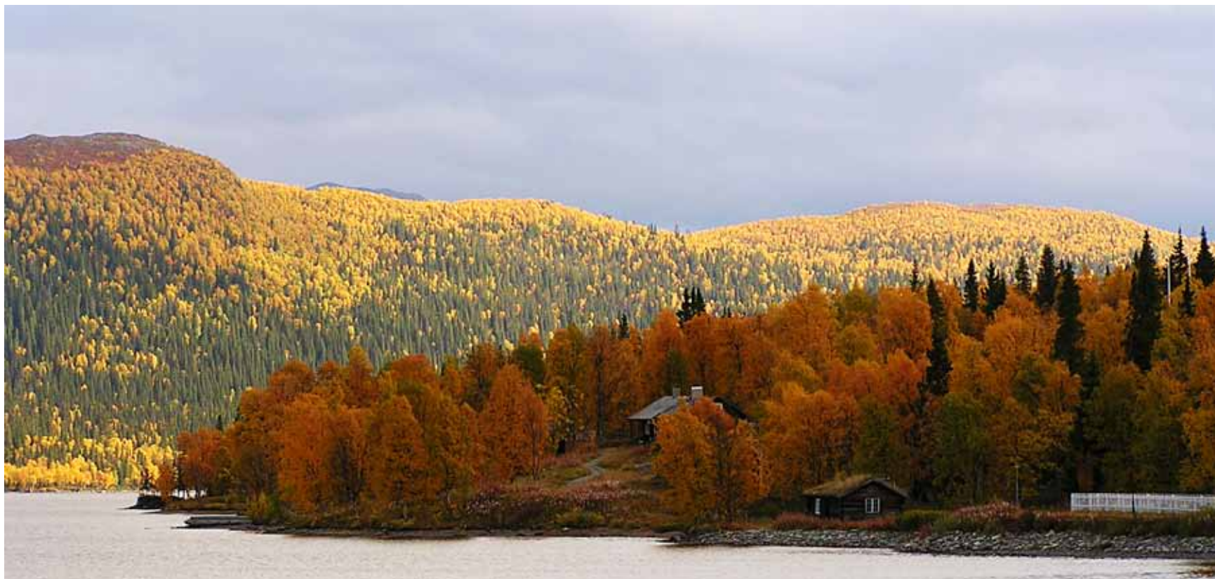
Fatmomakke i höstskrud.

Kontakten mellan Länsstyrelsen och byggnadsminnesägarna bör utökas. Att upprätta vårdavtal för byggnadsminnena kan vara bra för att säkerställa ett gott skick och även för att skapa framförhållning i Länsstyrelsens fördelning av byggnadsvårdsbidrag.