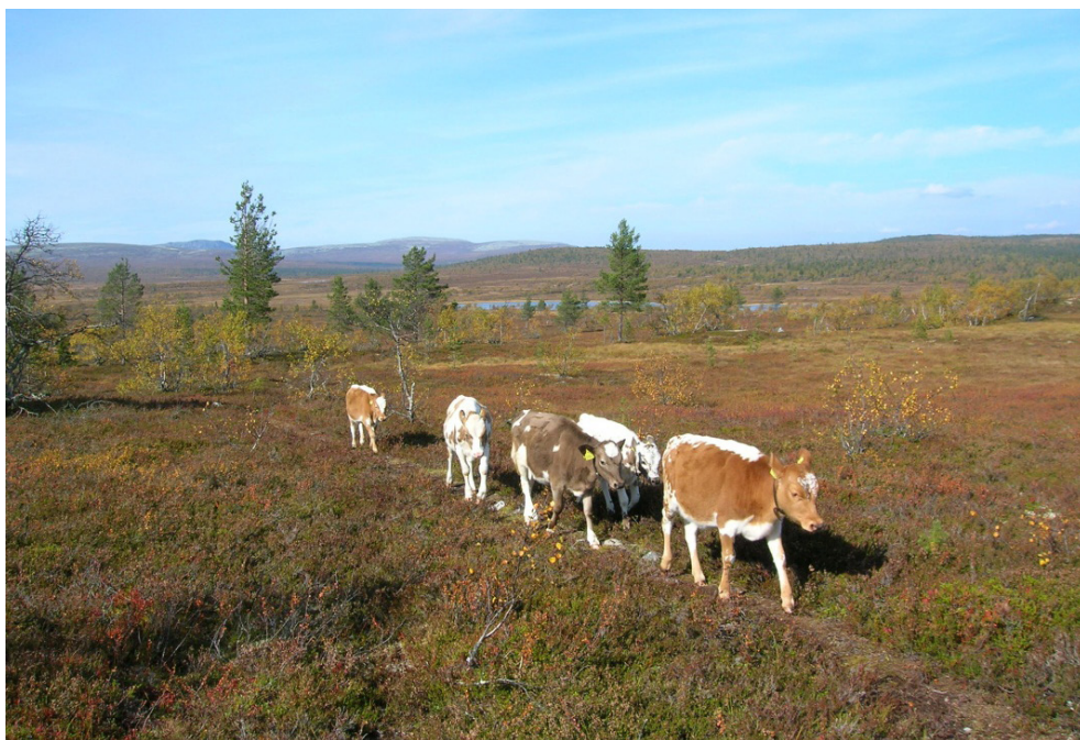
Kalvar på fritt bete på Hackåsen.

Men en miniminivå för gårdens skötsel måste fastställas i en ny skötselplan. Annars tappar reservatet helt sitt syfte. Målsättningen måste ändå vara att behålla reservatet som en representant för de nybyggen som anlades i slutet av 1700-talet och under 1800-talet i Norrlands inland. Det är en viktig del av regionens historia.