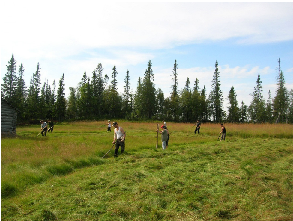
Slåtterkurs på Lillhärjäbygget.