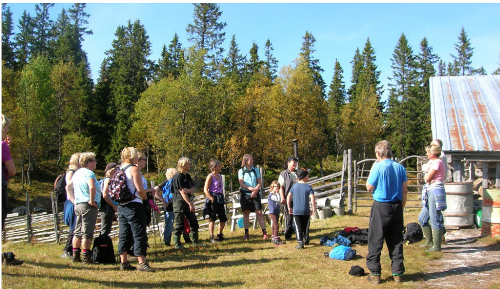
Kulturarvsdagen 2013, studiebesök på Hackåsvallen.

Kulturföreningen kan behöva kompetensutveckling för att kunna sälja in produkten. Alternativet är att låta något annat företag driva verksamheten, men då missar gården en del av förtjänsten och kan inte styra över genomförandet på samma sätt som när man driver i egen regi. Satsningen måste anpassas till den dagliga verksamheten med djurhållning och åkerbruk, vilket innebär vissa begränsningar. Förslaget kommer att öka gårdens intäkter och minska beroendet av bidrag från Länsstyrelsen.