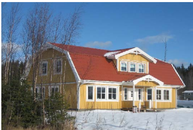
Foto: Nybyggnad, Alnö

Örnsköldsvik har brist på hyresbostäder i storleken 1-3 RoK, bostadsrätter 3-4 RoK samt en brist på egna hem i storlekklassen 120-150 kvm.