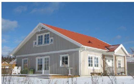
Foto: Nybyggnad, Alnön

* Svårt att komma igång med byggandet av hyreslägenheter på grund av aktuell bostadspolitik.