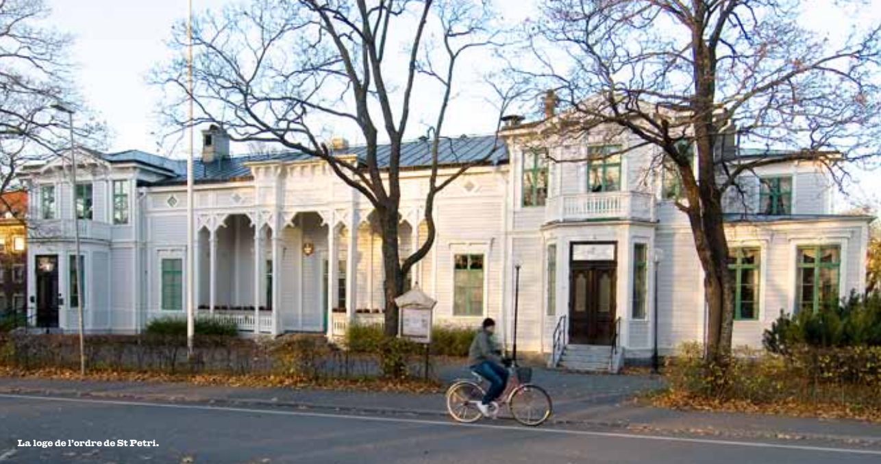
La loge de l'ordre de St Petri.

Öbacka se mirait dans l'eau Autour des plages scintillaient de petits feux, l'accordéon tintait au loin dans le pertuis, les bateaux de plaisance suivis de longs nuages de fumée se dirigeaient vers les îles et tous les cœurs roucoulaient et chantaient.