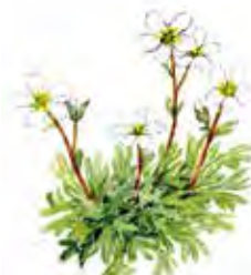
Tuvbräcka ( Saxifraga cespitosa )

Växer i klippskrevor och finns att se längs Grotstigen.