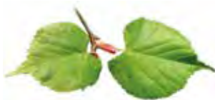
Lind ( Tilia cordata )

Märkligt nog hittar du på Skuleberget även fjällväxter som tuvbräcka, grönbräken och klynnetåg. De finns troligen kvar sedan perioden efter istiden, när klimatet var kallare.