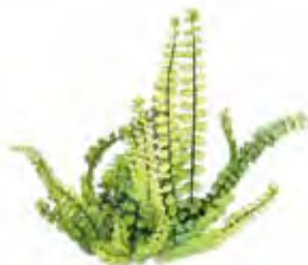
Svartbräken ( Asplenium trichomanes )

Karaktäristiska hjärtformade blad. Finns både som buske och träd och kan ses i början av röda/vita klätterleden.