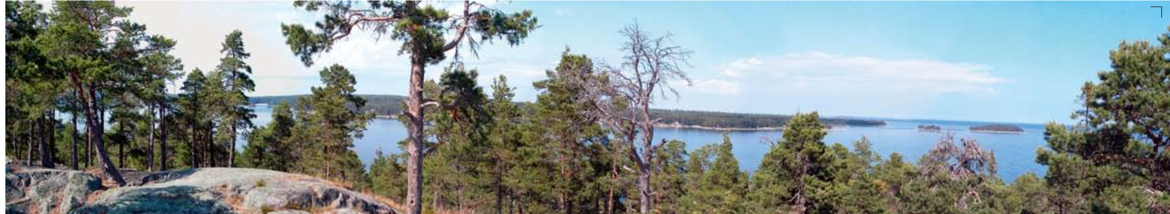
Utsikt från Skatberget