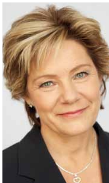
Barn- och äldreminister Maria Larsson är extra nöjd med att ANDT-strategin har ett särskilt mål för barn och ungdom.

– Det är helt i linje med FN:s barnkonvention. Droger är ett hot mot barns hälsa och en trygg uppväxt, och det är vårt ansvar att skydda dem. Det ska vi göra till exempel genom att supporta föräldrar och se till att vi har en väl fungerande skola. Trivs man i skolan är det ett bra skydd mot att hamna snett senare i livet.