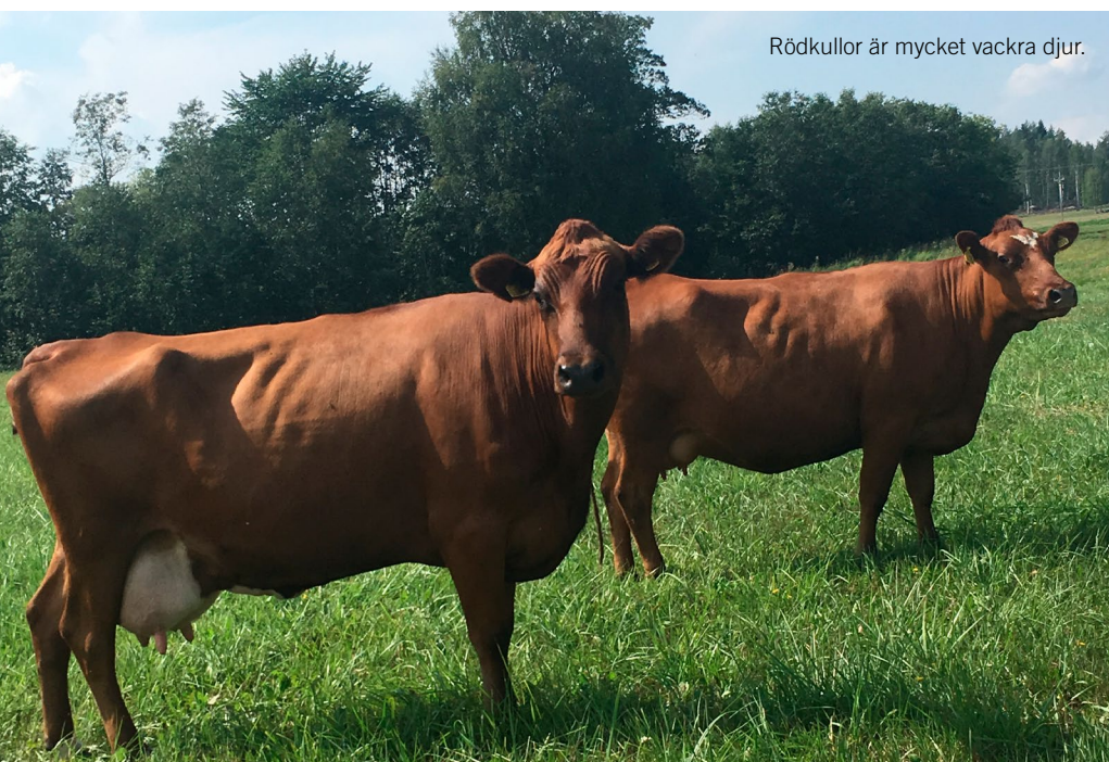
Rödkullor är mycket vackra djur.