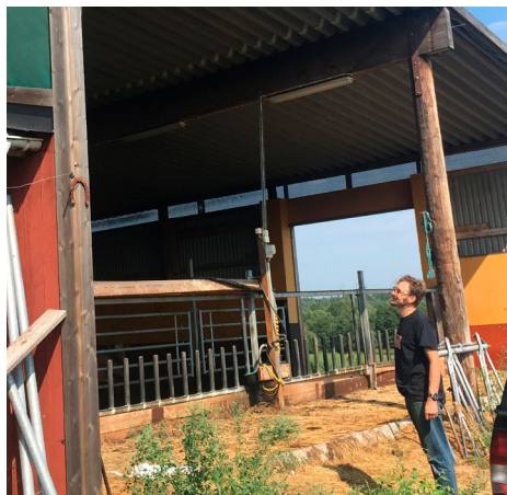
Per vid lösdriften byggd av material från egen skog.