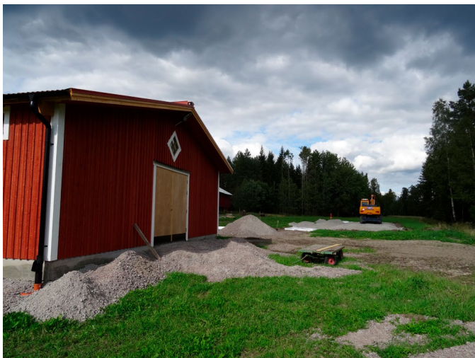
Markförberedelser i full gång inför byggandet av ytterligare ett stall