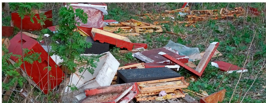
Bigård angripen av björn

Simon Viklund, Gävleborg 010-225 14 65 Simon.viklund@lansstyrelsen.se Ellinor Theorin, Dalarna 010-225 05 29