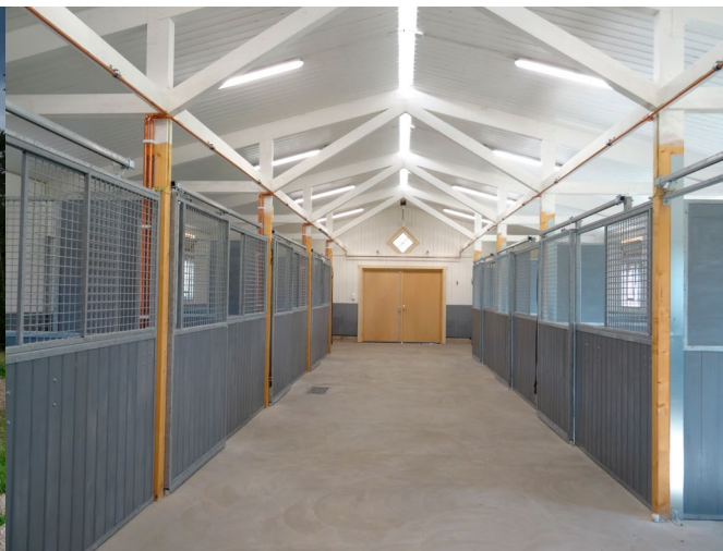
Det nybyggda stallet är ljus och luftigt