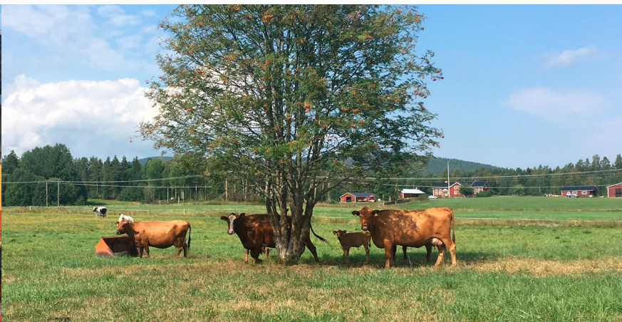
Sommaren 2018 har varit torr och varm. Det är skönt för djuren med lite skugga.