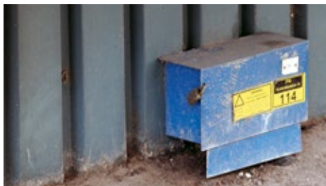
Bekämpar du skadedjur i dina byggnader? Tänk på att du ska spara dokumentation av bekämpningen.