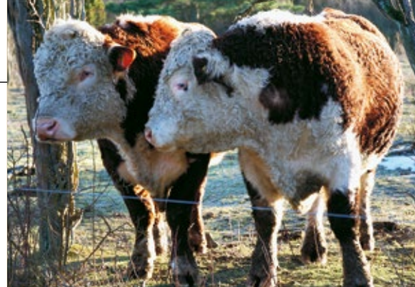
Efter den 1 augusti ska stutar och tjurar äldre än 6 månader hållas i lösdrift.

Susanna Svens 010-225 14 27 susanna.svens@lansstyrelsen.se