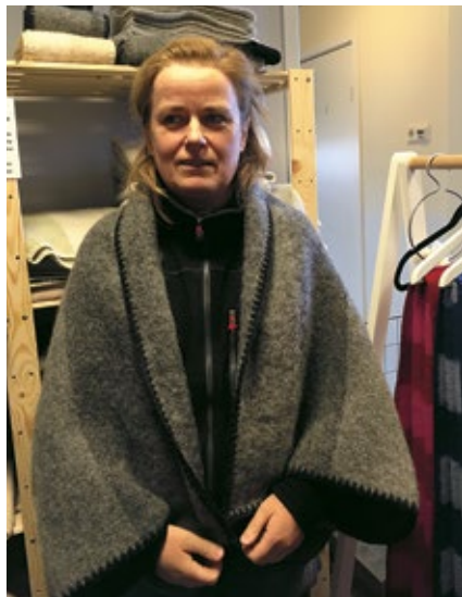
För dem som inte behöver en hel pläd finns axelfiltens som värmer.

Det produceras en del ull i vårt län som inte tas till vara. Förhoppningar om att det ska ändras finns hos fler än mig. Polyester och bomull är inte bra för miljön och på detta går det inte att producera på ett varsammare sätt här hos oss.