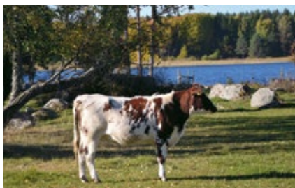
Nu är det betessäsong. Har du koll på vilka regler som gäller för dina djur?

Om djur hålls inne hela dygn i enlighet med någon av ovanstående punkter ska detta journalföras.