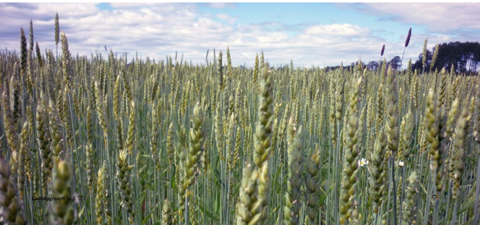
Höstvetet ger fina volymer men proteinet är svårt att nå.

Pia Björnell 070-562 02 12 pia.bjorsell@hushallningssallskapet.se