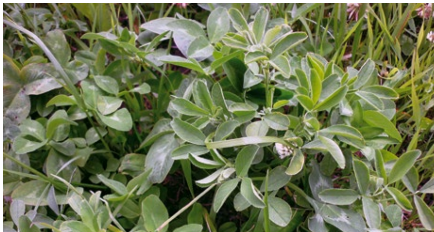
Både lusern, rödklöver och vitklöver trivs i MIDA Lantbruks slåttervallar.