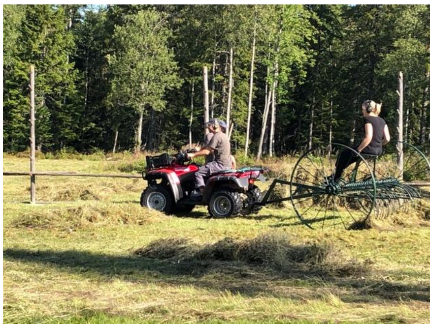
Räfsning sker med en restaurerad hästräfsa efter fyrhjulning, en utmärkt kombination eftersom häst saknas.

Detta tillvägagångssätt med stubbfräsning vid ängsrestaurering visar att det är en mycket lämplig metod att använda.