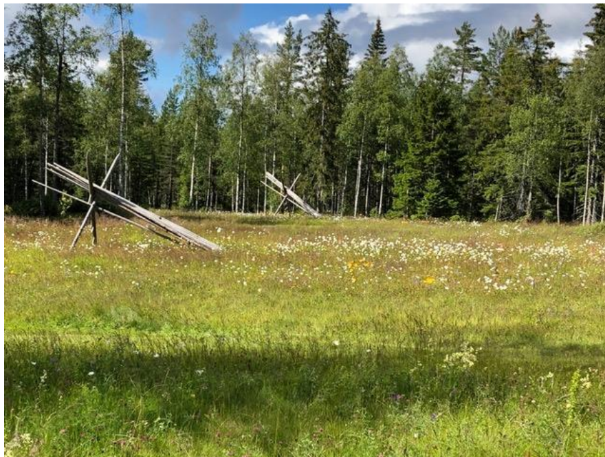
Den större ängen hävdas sedan 2010, efter en omfattande och lyckad restaurering

Fagning gör vi i april/maj. Slåttern sker varje år tredje veckan i juli. Deltar i slåttern och hässningen gör tre, ibland fyra, generationer av släkten. Slåttern på den större ängen sker med stor slätterbalk, och på den mindre ängen med mindre slätterbalk eller lie. Allt gräs hässjas på traditionella Leksandshässjor. Räfsning sker med äldre hästräfsa dragen av modern fyrhjuling (då häst saknas).