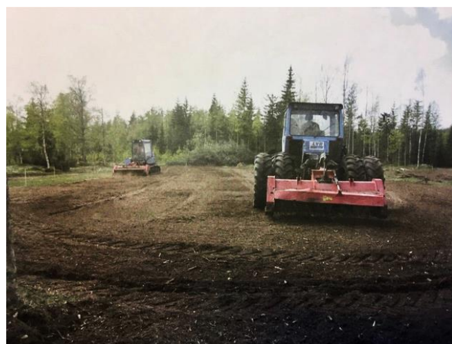
Fräsning av stubbar och mark, maj 2009