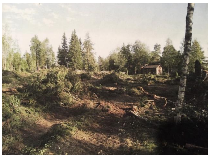
Avverkning på den gamla skogsplanterade ängen, hösten 2008