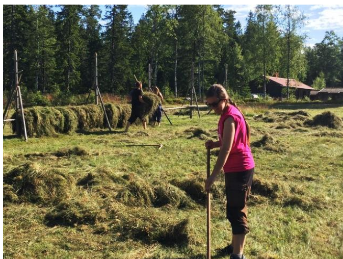
Hässning sker på traditionella Leksandshässjor.