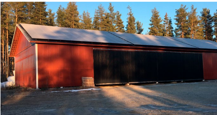
Januarisolen lyser från låg nivå. Kanske ska mer skog tas ner för att inte skymma?