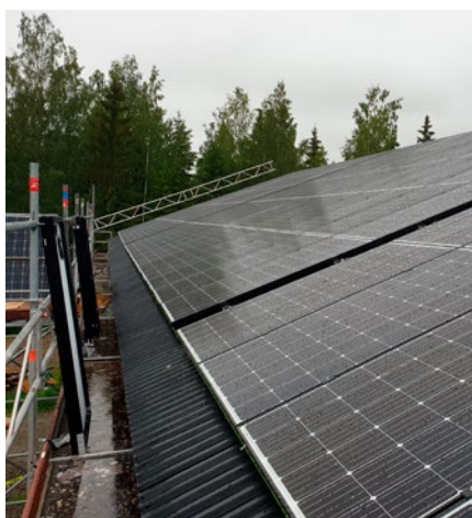
Taket täcks helt med paneler