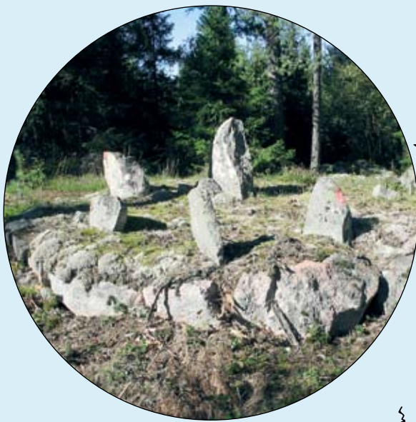
Välbevarat femstenarör på lågt postament.