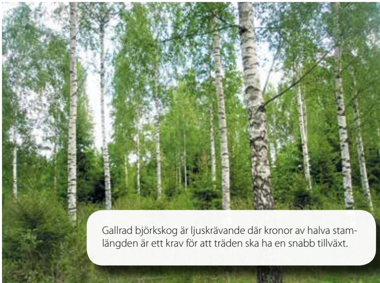
Gallrad björkskog är ljuskrävande där kronor av halva stamlängden är ett krav för att träden ska ha en snabb tillväxt.