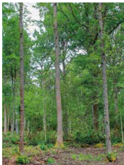
Produktionsträd av ek

Al bör röjas vid 2–3 meters höjd så att avståndet mellan plantorna blir 2–2,5 meter. Ofta är det frågan om stubbskott på socklar och då bör man lämna max tre stammar. Vid 6–7 meters höjd reduceras stamantalet till cirka 1 100–1 400 per hektar, vilket motsvarar ett avstånd mellan träden på cirka 2,7–3,0 meter. Oftast växer alen på mycket fuktiga partier och bör ibland sparas av naturvårdsskäl.