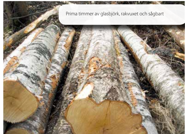
Prima timmer av glasbjörk, rakvuxet och sågbart