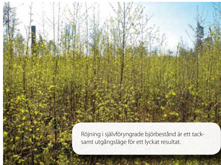
Röjning i självföryngrade björbestånd är ett tack-samt utgångsläge för ett lyckat resultat.

Tänk på att det är bättre att röja/gallra sent än aldrig. Du får ett stabilare och grövre bestånd som då också ger en bättre ekonomi på sikt. Det kan resultera i bättre sortiment i stället för att allt går som massaved eller bränsle.