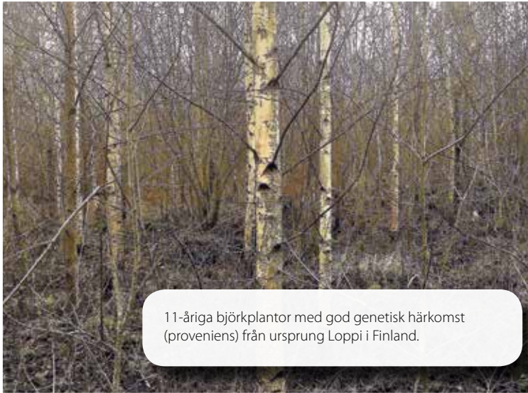
11-åriga björkplantor med god genetisk härkomst (proveniens) från ursprung Loppi i Finland.