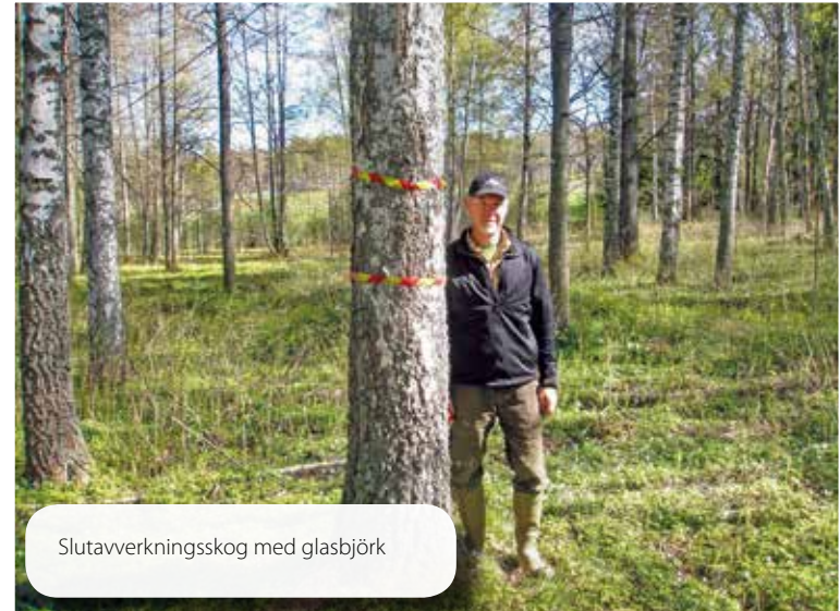
Slutavverkningsskog med glasbjörk

I övrigt är det kvistarnas antal, storlek och beskaffenhet som avgör förutom att stocken ska vara rak och "sågbar".