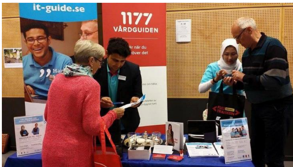
IT-guider i Örebro under nationella kampanjveckan för ökad digital delaktighet.

Projektet genomfördes 1 augusti 2015–31 december 2016.