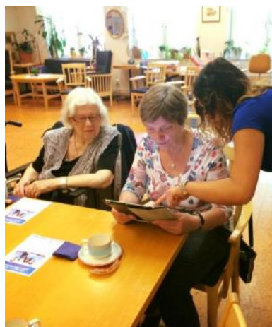
IT-guide hjälper senior i Lindesberg.

I projekten med primära och sekundära målgrupper överskrids generations- och kulturgränser, och där en ömsesidig förståelse för varandra etableras. Såväl den primära som sekundära målgruppen utvecklar sina kunskaper kring hur olika kulturer ser ut. IT-guide åsyftar till ett kunskapsutbyte mellan målgrupperna där de nyanlända ungdomarna lär sig bland annat språket och olika normer och värdering som finns i samhället, och seniorerna guidas in i den digitala världen. Genom att ha två målgrupper som normalt inte hade mötts, öppnas nya ingångar till ett nätverksskapande över generations- och kulturgränser. Nyfikenheten finns i båda målgrupperna om att vilja utvecklas, samtidigt som det finns nyfikenhet i att vilja förstå varandra.