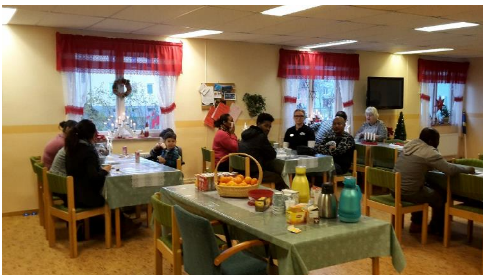
Flyktingguide i Sydnärke på ett matchningstillfälle i Laxå.

Tre av projekten är IT-guideprojekt, ett projekt för flyktingguide samt ett språkprojekt för nyanlända kvinnor. Projekten är spridda över länets kommuner men arbetar samtliga med att möta den situationen som man står inför. Projekten ska bidra till att göra samvaron bättre för individen, men även verka förebyggande mot ett segregerat samhälle.