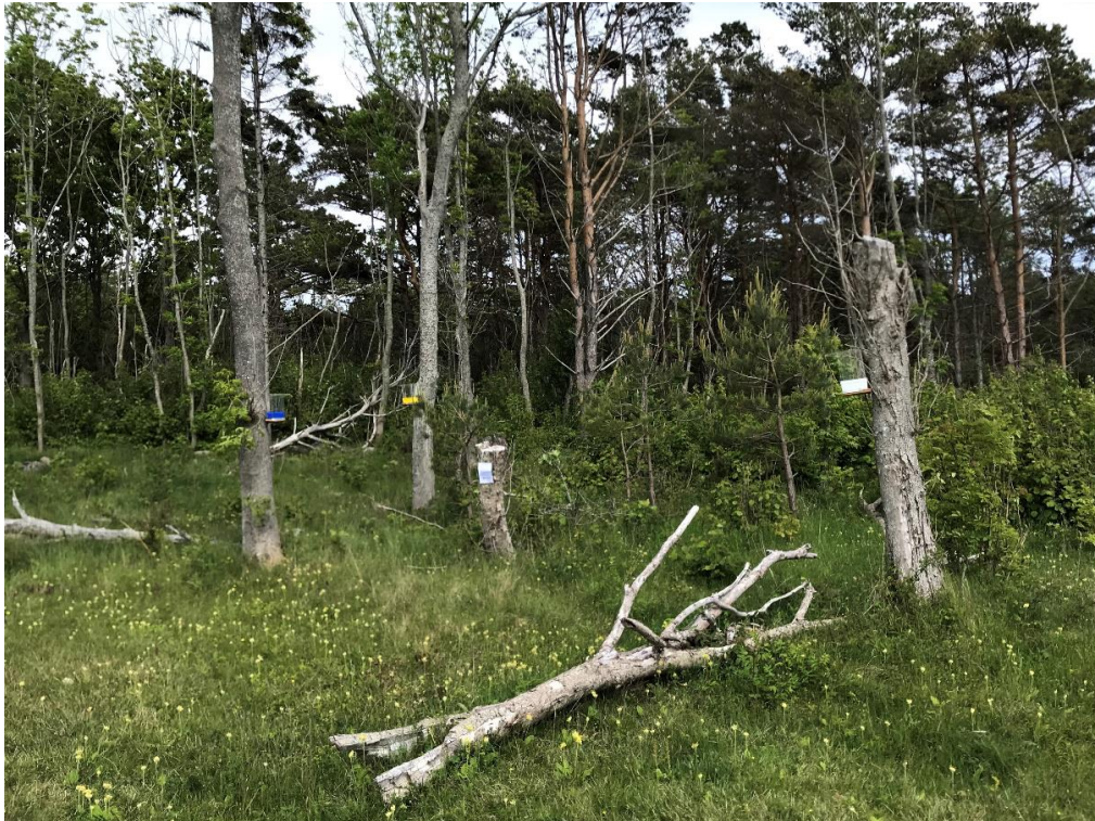
Figur 3. Färgskålarna i bryn mot strandäng vid Nästången på östra sidan av Sydkoster