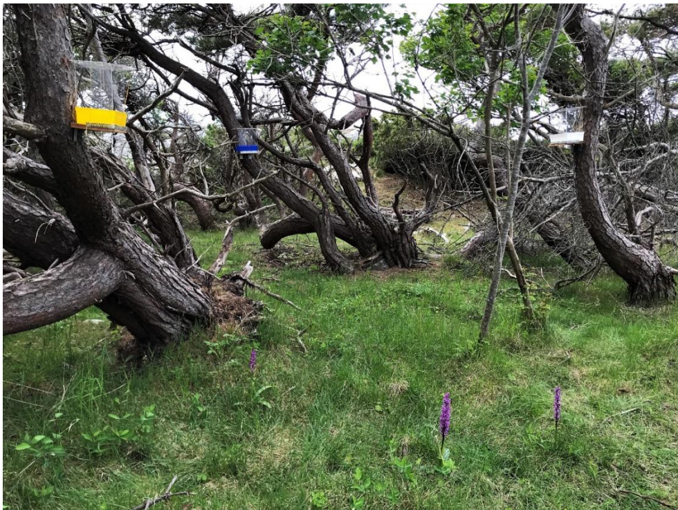
Figur 2. Färgskålarna vid Långegårdesholmen

Färgskålarna sattes upp den 2 juni de tömdes av personal från Länsstyrelsen under vecka 24. Proverna hämtades på Naturum och färgskålarna sattes upp igen den 20 juni. En sista tömning samt nedtag av färgskålar skedde den 20 juli. Sortering och artbestämning av det insamlade insektsmaterialet utfördes kontinuerligt under sommar och höst.