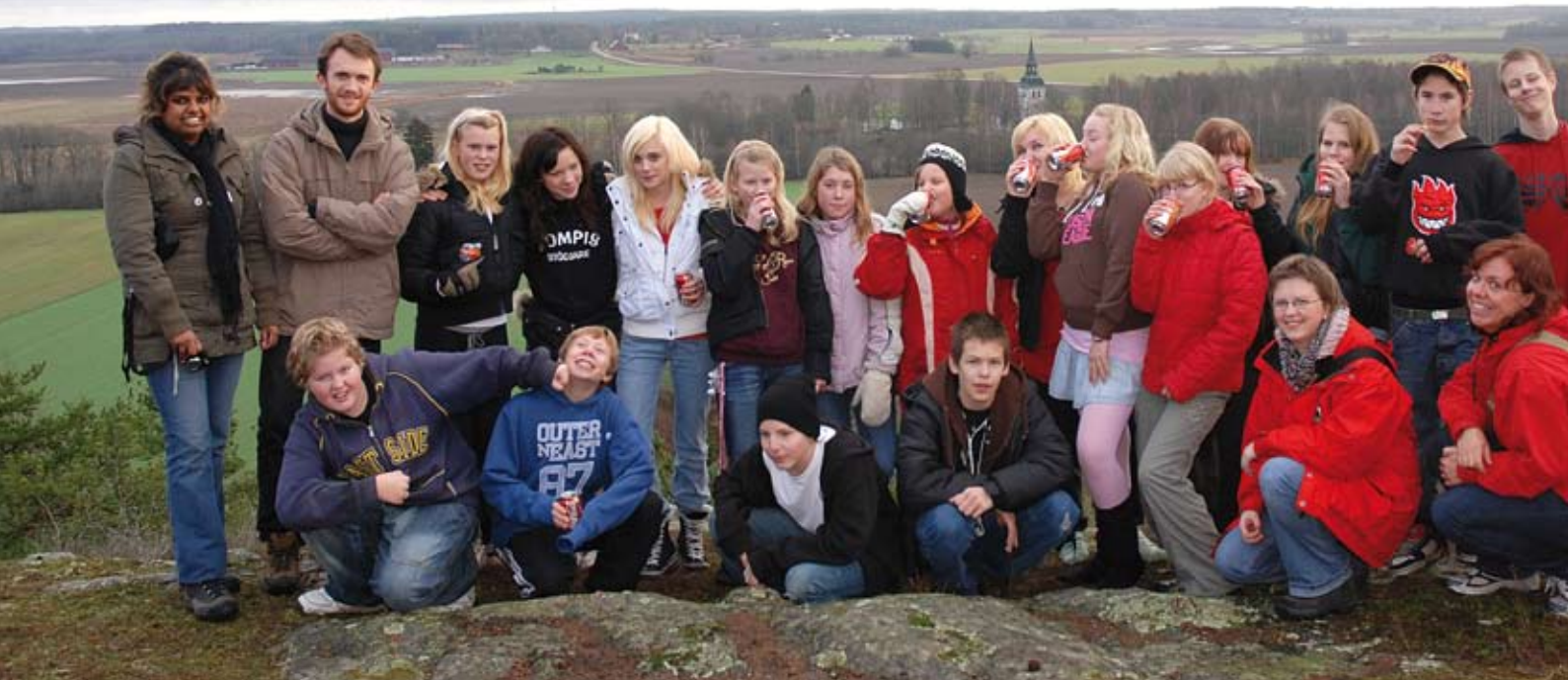
Högstadielklass från Vålbergsskolan på Hökberget vid Nors kyrka. På berget ligger en fornborg som troligen härstammar från järnåldern.