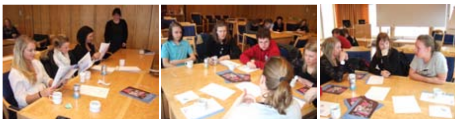
Eleverna från Vargbroskolans högstadium diskuterade engagerat hur de vill påverka klimat och sin miljö i framtiden.