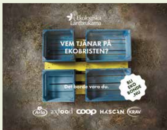
Exempel på marknadsföring för Bliekobonde.nu.

Kontakta HS rådgivare inom ditt område. Växel: 054-54 56 00.