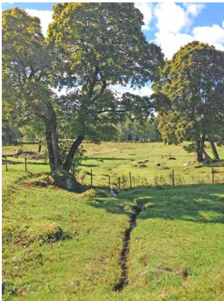
Naturbetesmarker och slätterängar är variationsrika. Det kan finnas värdefulla träd, kulturspår och biologisk mångfald på ett och samma ställe.