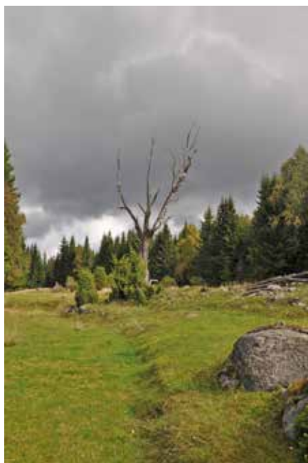
På Malmbäckarna framträder många åkerhak, det vill säga gränsen mellan äng och åker, tydligt.