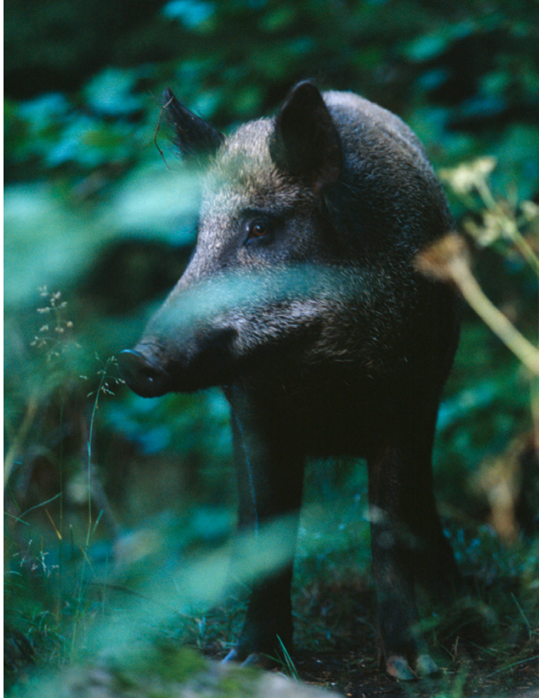
Avskjutning: Avskjutning vildsvin och dovhjort Östergötlands län 2011-2020.

Projektet går i linje med den förvaltningsplan för klövviltet i Östergötland som togs fram 2019 och den reviderade förvaltningsplanen för vildsvin som togs fram 2022, där samförvaltning och flerartsförvaltning framhävs som viktiga verktyg i den framtida viltförvaltningen.