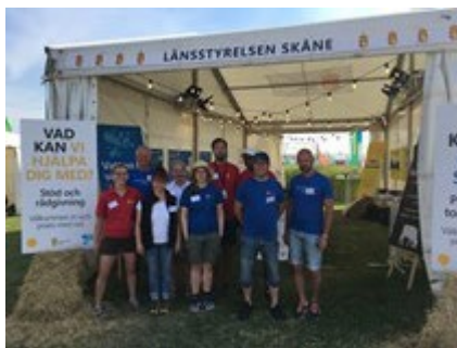
Delar av 2019 års Länsstyrelsecrew.

Hur ökar du din lönsamhet i dagens läge? Vi berättar om våra investeringsstöd, stöd till unga och om krisstödet som går att söka nu i juli. Utöver det har vi tips för hur du klarar fältkontrollen. Klimatklivets handläggare är också på plats och diskuterar vilka möjligheter som finns för lantbruket i årets utlysning. Vi bjuder även in till två seminarier i seminarietälten Axet och Vippan.