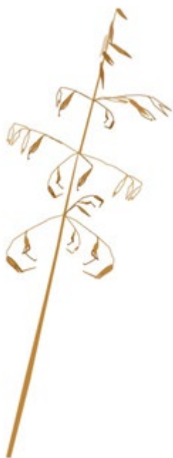
Flyghavre. Illustration: Kristina Larsson,

Vagnarna som du transporterar spannmål med ska vara täckta om du inte är helt säker på att