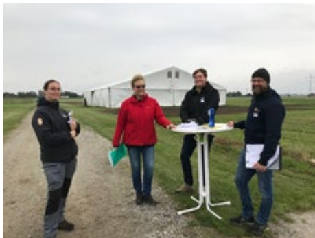
Välkomstkommittén från Ekodagen 2021