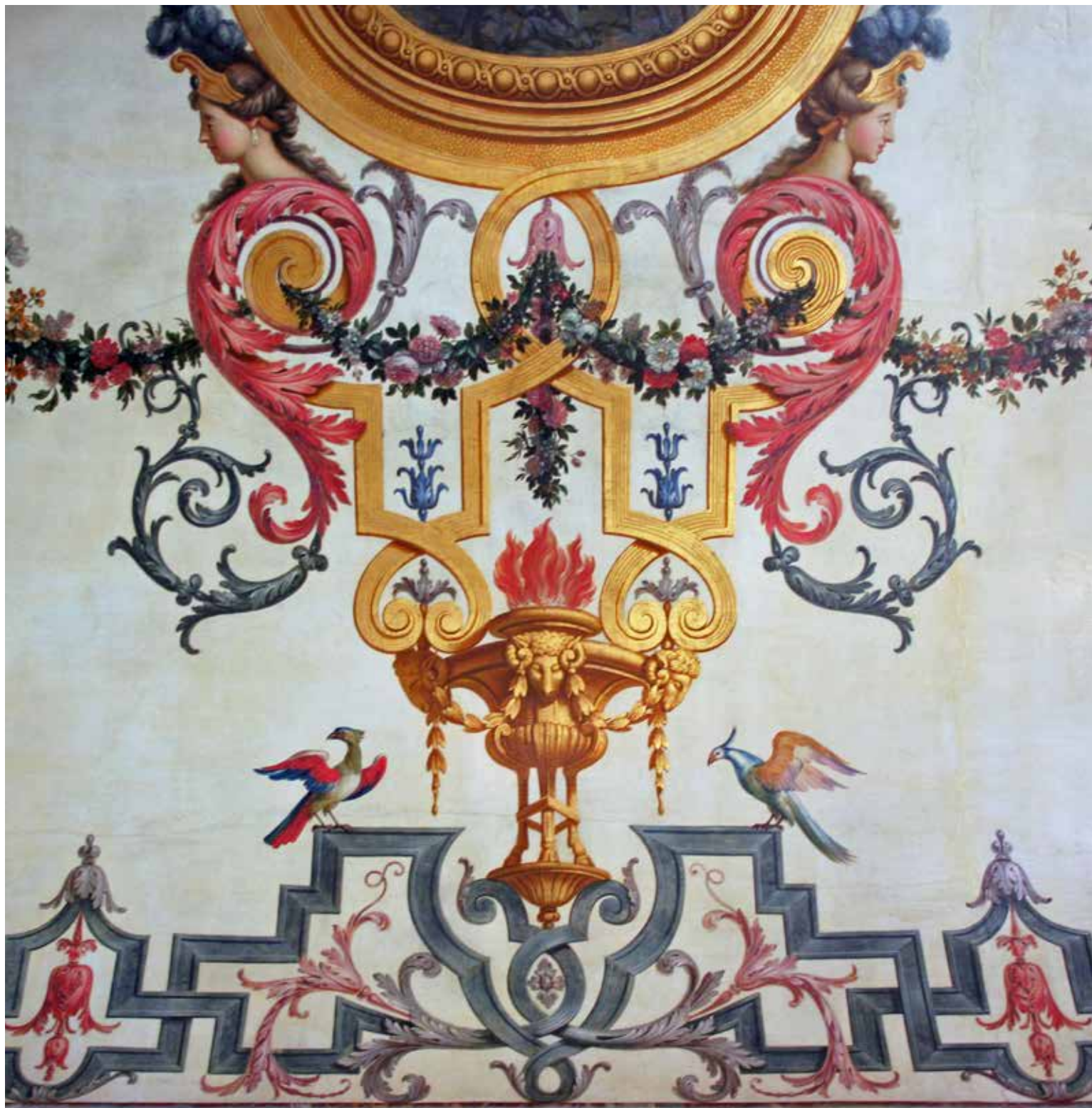
Detalj ur takmålning i paradvåningen bevarad från Tessins tid.