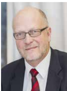
Sven-Erik Österberg landshövding i Stockholms län

"Detta hus är bygd efter alla order i Architecturen: är det enda i hela Riket, som utlänningar av alla Nationer erkänna för ett mästerstycke i Bygningskonsten, och af samma rang i Vitruvisk bygnad, som de hus i Italien, dem man betalar pengar för at få bese."