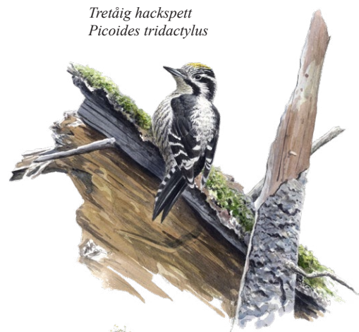
Tretåig hackspett Picoides tridactylus

Det som är typiskt för en riktig gammelskog är den stora variationen. Träd i alla åldrar jämte döda träd skapar en mängd olika livsmiljöer för såväl växter, svampar, mossor, lavar, insekter och smådjur. Lunglav, tallticka, svartvit taggsvamp, ullticka, vågig sidenmossa, stubbspretmossa och långfliksmossa är några av områdets sällsyntheter. I de döda träden lever många olika insekter, som i sin tur lockar till sig hackspettar och andra fåglar som låter sig väl smaka av dess larver. Marken här i sluttningen är bördig och delvis även kalkpåverkad. Det märks inte minst i den ovanligt rika växtligheten. Här finns bland annat sårläka och den lilla orkidén knärot. Något som är gemensamt för många av gammelskogens arter: de har svårt att klara sig i våra modernt och storskaligt brukade skogar.