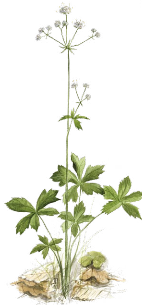
Sårkläka Sanicula europaea