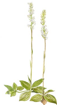
Knärot Goodyera repens

Illustrationer: Niklas Johansson (hackspett), Jonas lundin (knärot, sårläka), Lennart Molin (lunglav, tallticka).