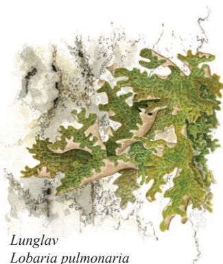
Lunglav Lobaria pulmonaria

Illustrationer: Niklas Johansson (hackspett), Jonas lundin (knärot, sårläka), Lennart Molin (lunglav, tallticka).