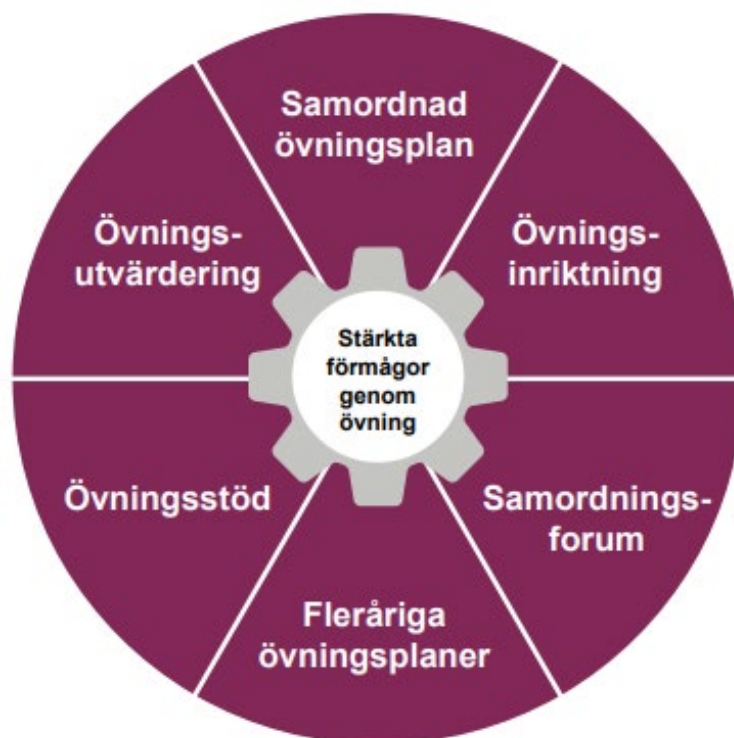
Illustration lånad av Myndigheten för civilt försvar, tidigare MSB.

Modellen illustrerar de olika delområden som utgör grunden för ett systematiskt arbete. Delområdena skapar en helhet och förutsättningar för en effektiv övningsverksamhet.