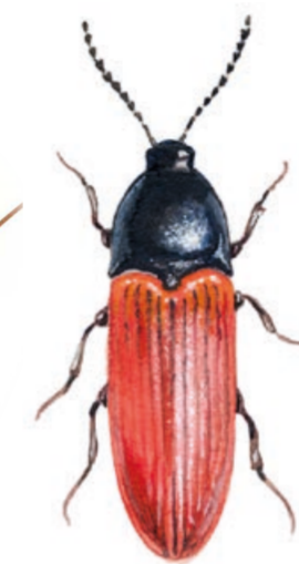
Bokskogsrödbeck ( Ampedus rufipennis ) En skalbagge som är beroende av miljöer med grova döende bokar.