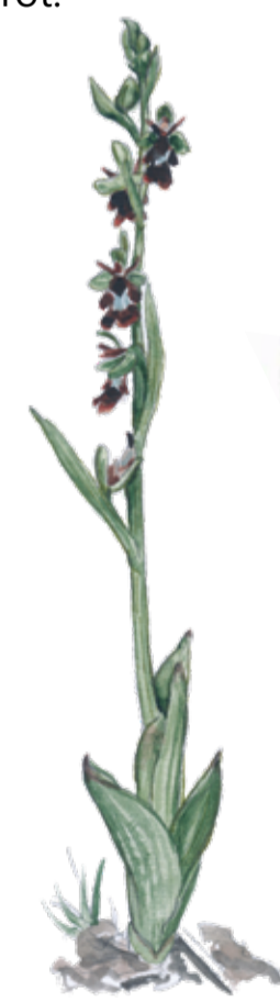
Flugblomster Ophrys insectifera Fly orchid