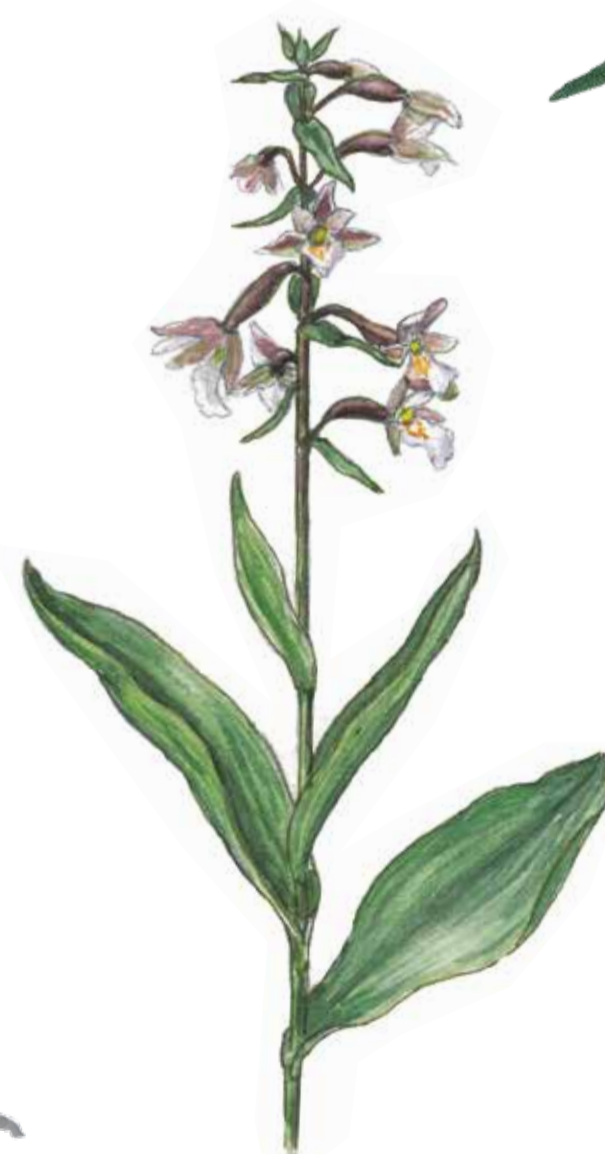
Kärrknipprot Epipactis palustris Marsh helleborine