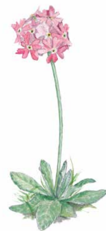
Majviva Primula farinosa Bird's eye primrose

De kalkrika, öppna kärren har ett rikt växtliv. I reservatet finns tretton olika sorters orkidéer, till exempel flugblomster och kärrknipprot.