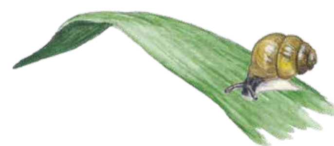
Den lilla kalkkärrsgrynsnäckan behöver kalk till sitt millimeterstora skal. Vertigo geyeri Geyer's whorl snail

Amidst fields and pastures, Åraslöv Mosse is a lush island full of unusual plants, birds, and butterflies. Paths and boardwalks take you through rich broadleaved woodlands, dense wet woodland and open fens with impressive orchids and carnivorous plants. Welcome out!