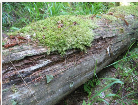
Klibbticka (till vänster), svartoxelarv (mitten) och lämplig låga (till höger).