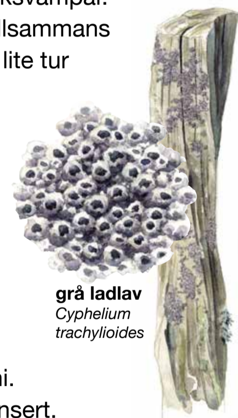
grå ladlav Cyphelium trachylioides