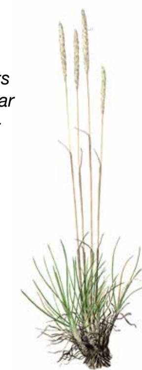
tofsäxing Koeleria glauca Crested hair-grass

Welcome to Sånnarna Nature Reserve! In the past, the whole of the Kristianstad plain was an area with few trees and wide-stretching, cultivated sandy fields. Today, only fragments remain of this old agricultural landscape, such as the one you see here in Sånnarna Nature Reserve. At first sight, the landscape may seem plain and lifeless, but appearances can be deceptive – here you find an exceptional diversity of herbs, bees, butterflies, dung beetles and fungi. And Paddgropen, the old gravel pit to the north, is one of the best habitats in Skåne for the natterjack toad.