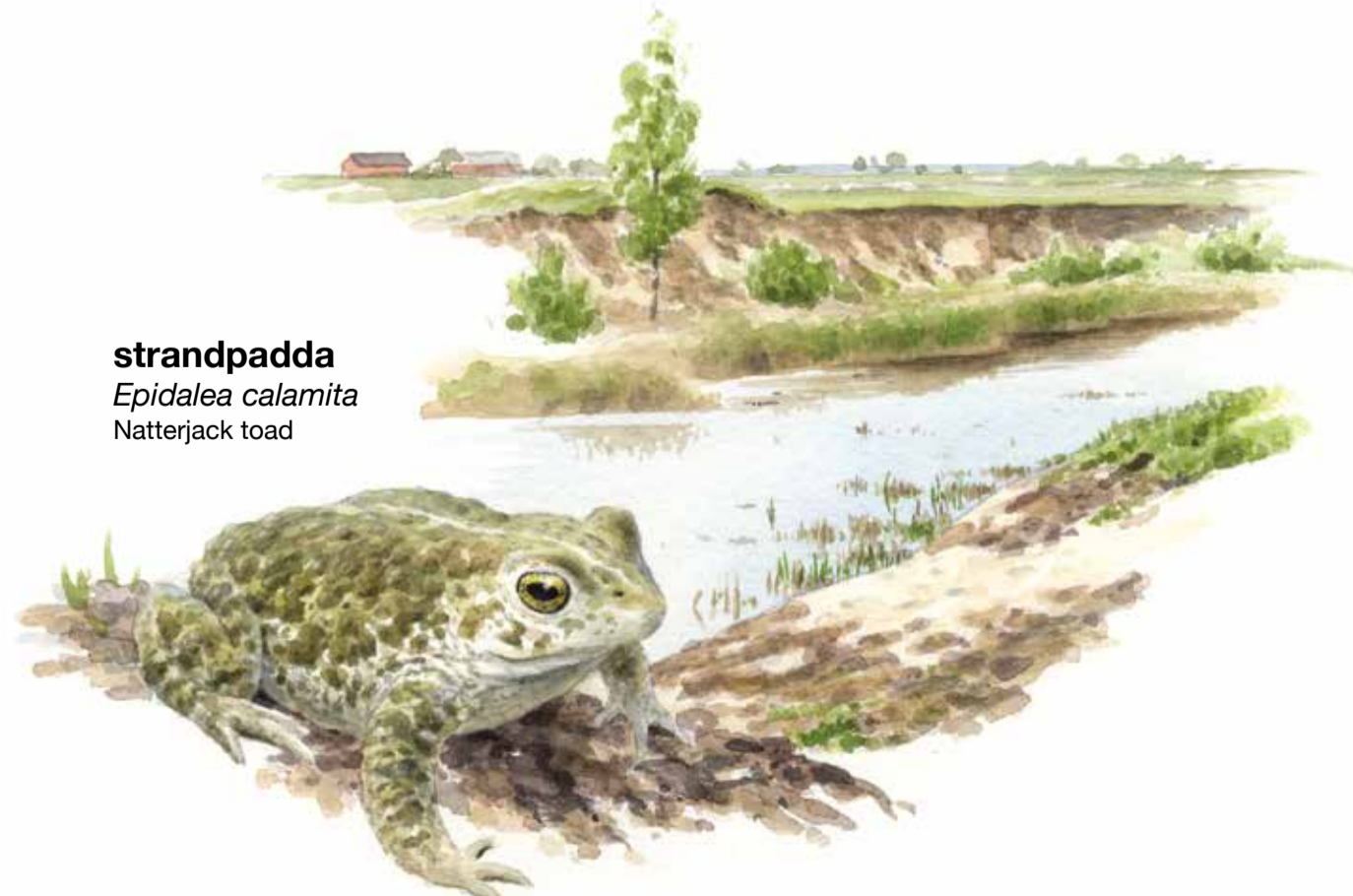
strandpadda Epidalea calamita Natterjack toad

Från Paddgropen i norr hörs ett metalliskt knarrande läte från mitten av april till långt in i juni. Det är den sällsynta strandpaddan som håller konsert. Det gamla grustaget är en av Skånes bästa lokaler för denna lilla krabat, som är vår minsta padda och ett av Sveriges mest hotade groddjur. Paddorna ligger nergrävda i sanden på dagen men i skymningen kryper de fram för att äta, spela och para sig. Under stilla kvällar kan de kärlekstörstande hannarnas sång höras flera kilometer.