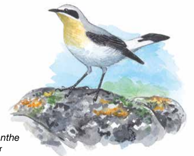
stenskvätta Oenanthe oenanthe Northern wheatear

To find out more about the sandy soils and their inhabitants, you can visit Sånnarna Outdoor Museum located right on the sand heath. The exhibition is surrounded by a demonstration plot showing how the nutrient-poor sandy soils were cultivated in the past. Here is also an old machine gun bunker, which together with the fire trenches in the southern part of the pasture remind us of the period when Sånnarna was used as a military training ground.