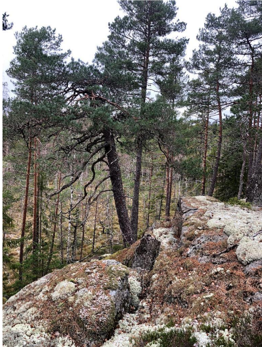
Gammal tall i Västansjö naturreservat.

Skötselplanen utgör bilaga 1 till reservatbeslutet. Skötselplanen är upprättad av Åsa Forsberg.